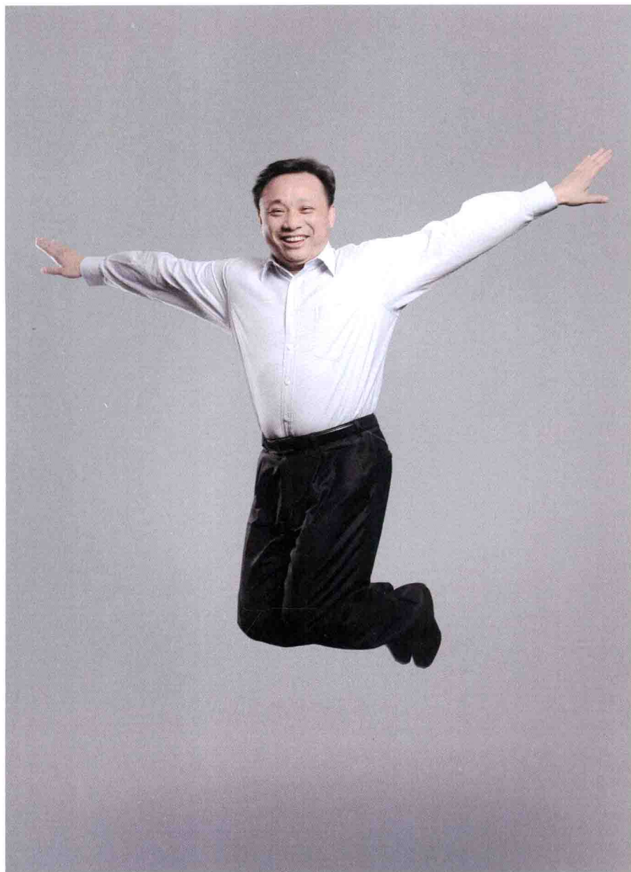
中诚信董事长毛振华 跳跃