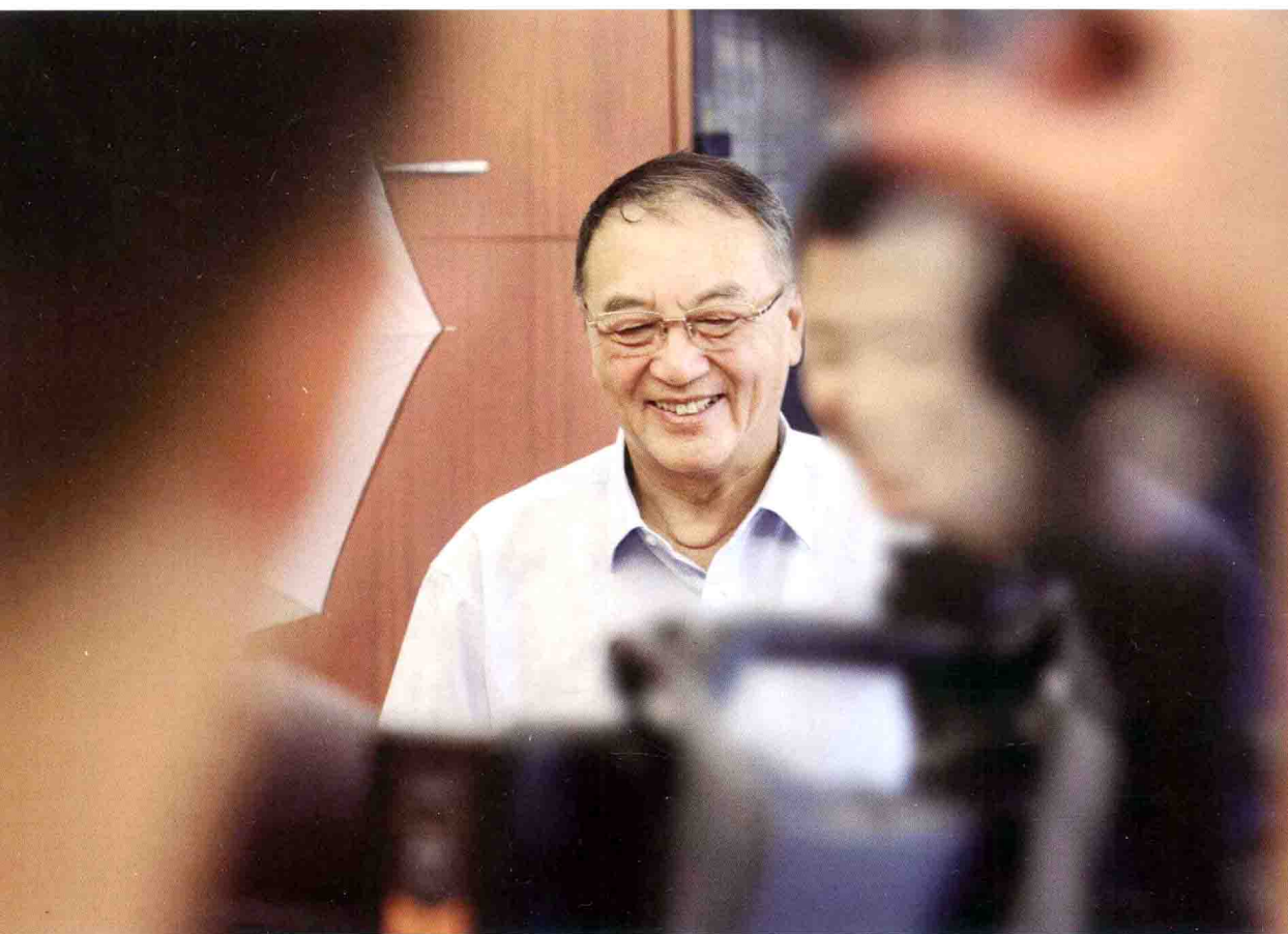
柳传志笑容满面地走进采访室