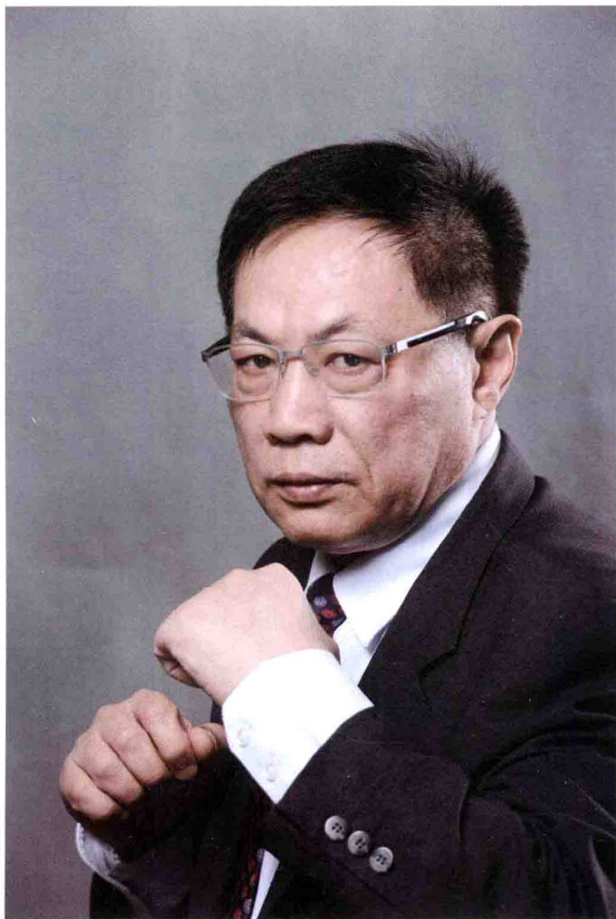
任志强：勇敢无畏的地产大炮