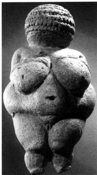
图 1-4. 维伦多夫维纳斯 公元前 28000—公元前 25000