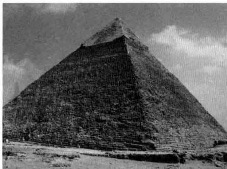
图 2-1. 吉萨大金字塔 约公元前 2551—公元前 2472

埃及艺术也是现代艺术能够追溯到的最古老的源头。尽管我们发现了欧洲的岩画和北美的印第安人艺术，但我们很难在这种奇特的艺术与当今艺术之间建立起某种联系。然而，埃