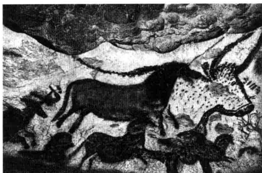
图 1-3. 拉斯科洞穴的马饰带 约公元前 15000—公元前 13000

这些留存在岩壁上的千古图像，也许正是人类的祖先在祈求上天赐给他美食时，不经意中留给我们的吧？！