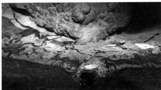
图 1-2. 拉斯科山洞内景 约公元前 15000—公元前 13000