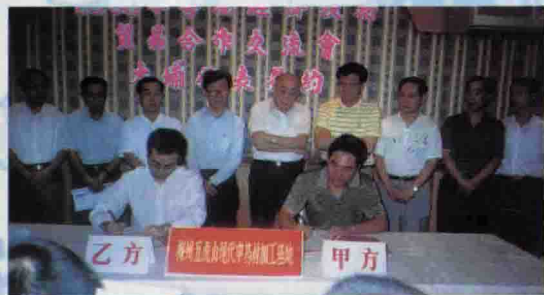
△大埔代表在2003年粤港经济技术贸易合作交流会上签约

为加快全县外向型经济的健康稳步发展，县外经贸部门在县委、县政府的正确领导下，坚持实行投资主体多元化、贸易市场国际化、招商方式灵活化、引资领域广泛化，开展以侨引商、以情引商、以园引商、以商引商和关联项目招商、预约招商、以会招商、环境招商、资源招商。对外向型企业坚持做到：重点的，跟踪服务；日常的，限时服务；特殊的，特别服务。全程提供“一站式”、“保姆式”、“个性化”、“全方位”服务。2003年，县外经贸局根据新一届县领导班子提出的“开放旺县、瓷工富县、农业稳县、人文兴县”发展思路，将以更加开放的姿态、更加扎实的作风、更加创新的方式，用培育外向型经济新的增长点创造外经贸新的业绩。