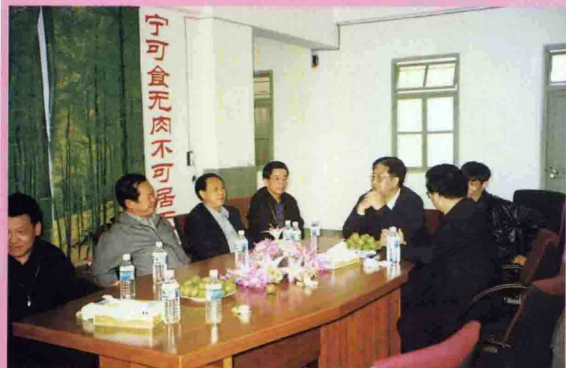
◁1月17日，省委副书记刘凤仪（右3）莅埔检查工作。图为在宜和竹具家私厂调研