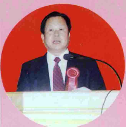
△县委书记曾百友作乡情报告