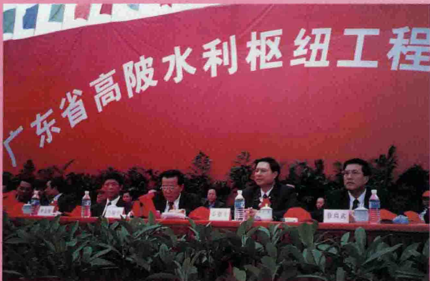
△12月18日，省政府在大埔县古野镇九龙村举行广东省高陂水利枢纽工程奠基仪式。图为省委副书记、省长卢瑞华（右3）在仪式上致辞