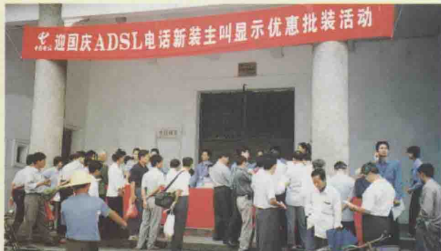
△ADSL宽带业务深受用户欢迎