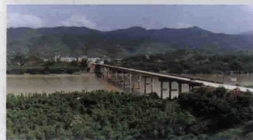
△通往县火车站和三河综合工业园区的朱德纪念大桥

三河镇党委、政府制订出建设大埔次中心城市的发展思路，两个文明建设取得了显著成绩。全镇12个行政村开通了四级乡村公路，6个村道实现了硬底化。兴建各种桥梁8座，把三河镇的水陆交通紧紧连在一起。投入700多万元扩容、更换程控电话交换机，电话装机达3000多门。投入资金750万元，小水电装机1540千瓦，年产值180万元。全镇有中学2间，完全小学15间，先后兴建17间中小学教学大楼。广播电视普及覆盖率达98%以上。