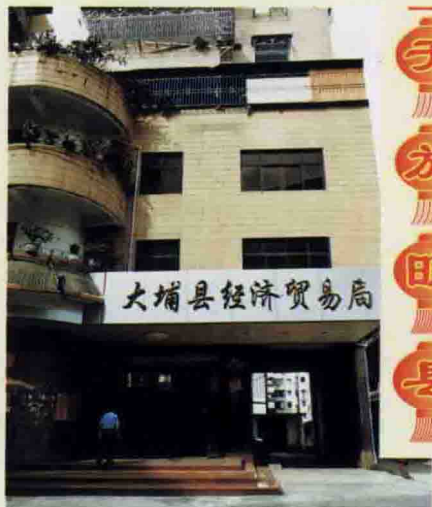
△大埔县经济贸易局办公大楼