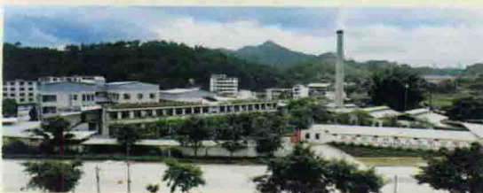
△特种陶瓷有限公司厂景

大埔县特种陶瓷有限公司是专业生产A-99、A-95结构陶瓷的广东省高新技术企业，主要品种有各类型真空瓷壳、绝缘子、瓷基片、坩埚、垫板，并能承接用户所需生产异型、特异型产品。