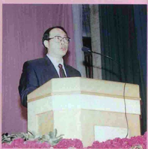
△市委副书记、市纪委书记何正拔讲话