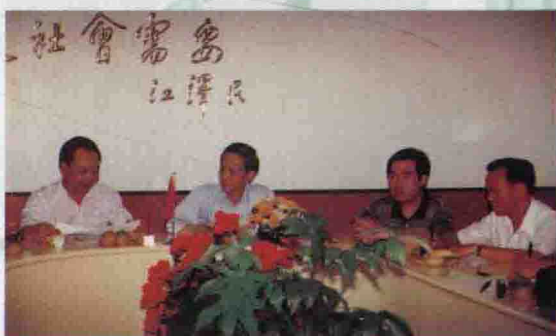
△县领导关心邮政事业，听取局领导的工作汇报