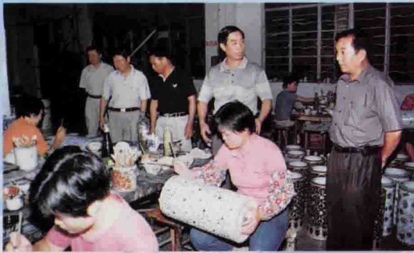
△局领导到出口型企业华艺公司调研