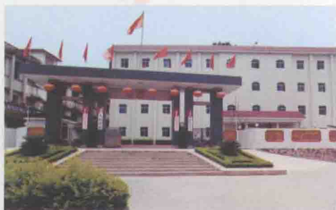
△高陂镇党委、镇政府办公大楼

地址：高陂镇福地街1号 电话：(0753)5858793 传真：(0753)5858793 邮编：514247