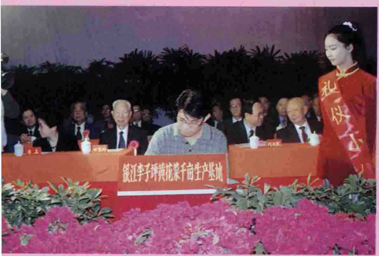
△招商引资签约仪式