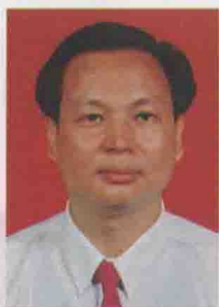
△镇党委书记： 黄国良