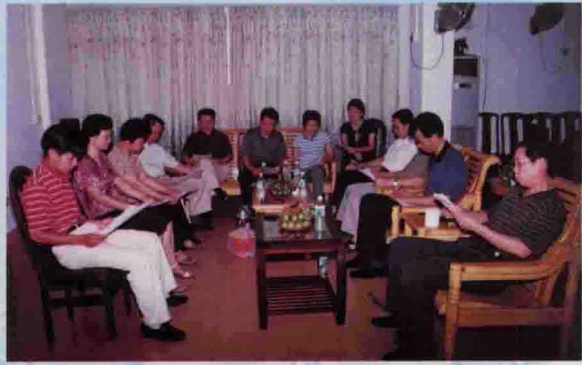
△该局党员干部正在进行纪律教育学习月活动

大埔县对外贸易经济合作局是主管对外贸易和国际经济合作的政府职能部门。从1984年引进第一家外商投资企业开始，全县“三资”企业从无到有，从小到大，从单一化到多元化，投资客商来自美国、日本、新西兰、泰国、马来西亚、新加坡、香港、台湾等11个国家和地区。至今，累计引进合同外资8777万美元，实际利用外资5655.3万美元，较为正常经营的“三资”企业有48家，年缴交县级税收均在1000万元左右，从业人员3000多人，拉动了全县陶瓷、电子、农林业、水电、矿泉、制衣、商旅等行业的快速协调发展。对外贸易以陶瓷产品为主，年出口额均在3000万美元以上，外向型经济已成为全县地方经济的一大支柱。