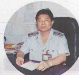
△高陂工商所曾垂 嵩所长在办公