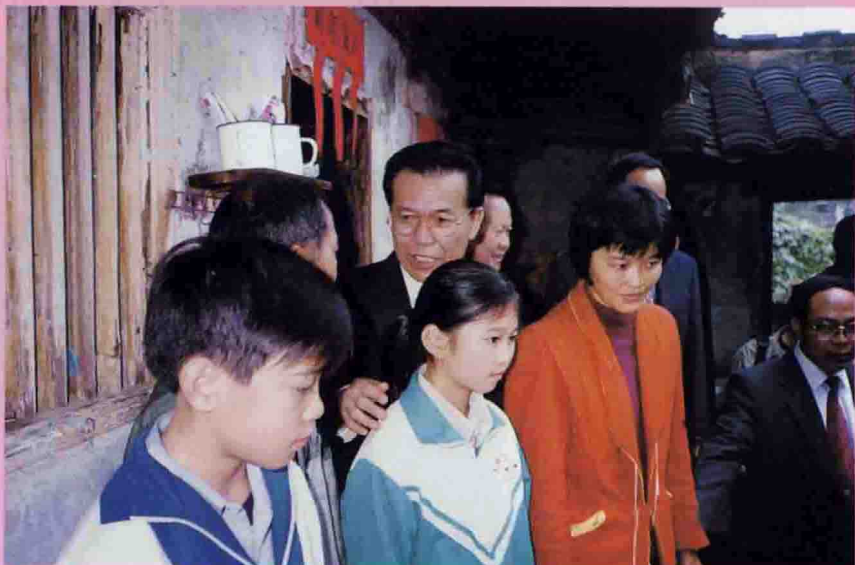
△12月18日下午，省委副书记、省长卢瑞华深入大麻镇青里村慰问特困农户邹思胜一家