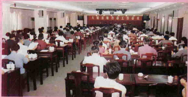
◁7月23日，县委、县政府召开大埔县地方志工作会议，全面启动全县第二届新方志编修工作