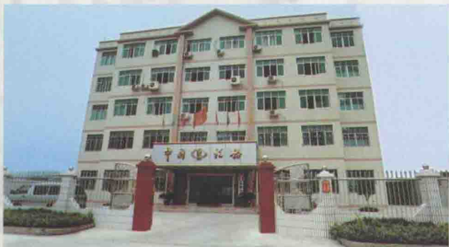
△高陂国税分局办公大楼