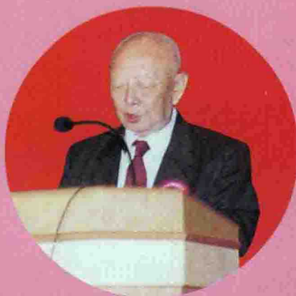
△ 原国家水利部副部长、珠江水利委员会主任刘兆伦讲话