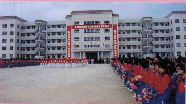
◁10月29日，大埔县田家炳实验中学落成剪彩