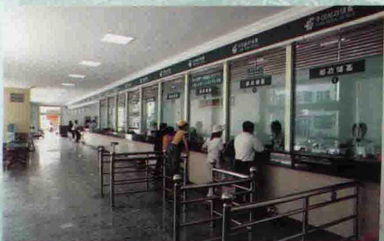
△宽敞明亮的星级邮政营业大厅