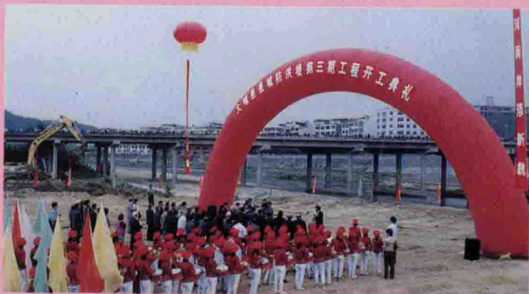
▷10月29日，县委、县政府举行县城防洪堤第三期工程开工典礼