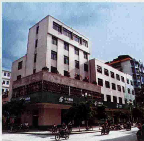
△大埔县邮政局办公大楼