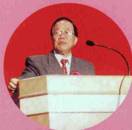
△ 原广州市政协主席邹梦兆讲话