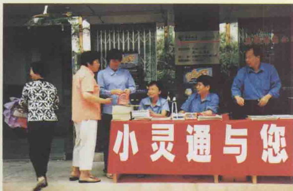
△小灵通成为县城用户新宠