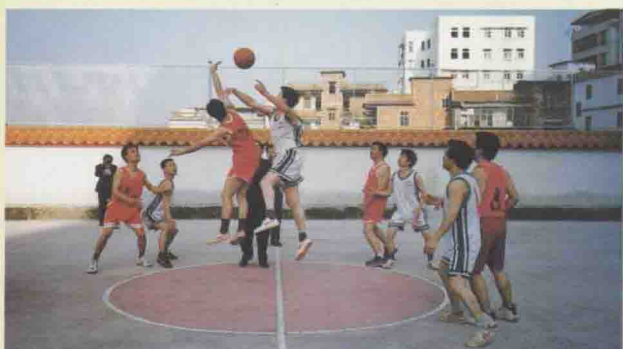
△篮球场上龙争虎斗

近年来，大埔县电信局在县委、县政府和市分公司的正确领导下，坚持“两手抓，两手都要硬”的方针，坚持“用户至上，用心服务”；以“为人民群众提供优质、高效的信息化服务”为己任，紧紧围绕企业中心任务，努力提高创建文明行业工作水平。