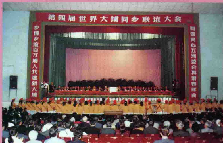
△ 10月29日,第四届世界大埔同乡联谊大会在县城隆重举行