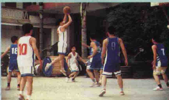
△丰富多彩的体育活动

忆往昔，1998年邮电分营时，大埔邮政业务总收入543.08万元，亏损245.8万元。但大埔邮政人没有退缩，始终紧紧抓住“发展才是硬道理”这个纲，努力开拓市场，拓宽业务，使各项业务都得到了长足发展。特别是邮政储蓄业务，2001年实现了全县12个邮储网点全国联网，代理了社保离退休养老金和乡镇公务员、教师工资统发业务，极大地方便了群众，使邮政知名度迅速提高。同时加快了电子汇兑、特快、报刊、函件、包件、汇票、集邮等业务的发展，满足不同阶层客户的用邮需要。县邮政局以人为本，坚持狠抓服务质量的提高和改善，克服服务工作的“四难”现象。2002年对县城和茶阳、银江、百侯、枫朗等支局营业场地进行整治，为广大用户提供了优美的用邮环境。