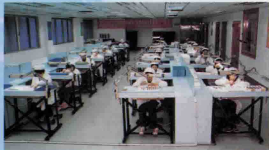
△全县外商投资骨干企业——天王电子有限公司车间一角