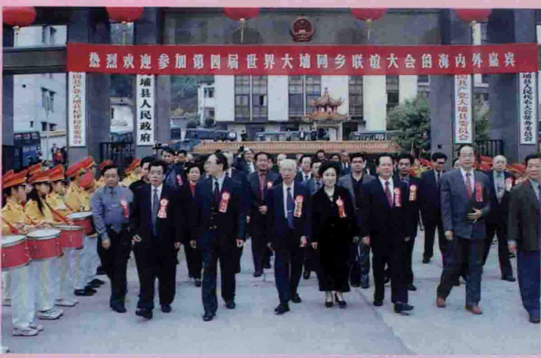
△海内外嘉宾走向会场