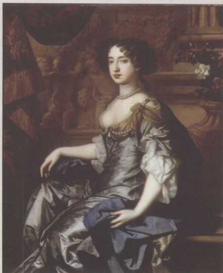
◎ 玛丽二世 由于害怕惨遭和查理一世同样的下场，詹姆斯二世仓皇逃离英国，他的女儿、女婿未费一枪一弹，就轻易夺得了王位。

却有个不为人知的隐私，就是同性恋。她热恋的对象是王家鹰苑管理员的女儿弗兰西丝·阿斯普利。在一连串情谊绵绵的信中，玛丽毫不掩饰地表达了自己对弗兰西丝的爱情，但她显然没有忘记自己的性别，口口声声地称对方为“丈夫”。这段恋情最终无奈地结束了。一方面由于弗兰西丝的冷漠，另一方面也是因为父王的压力。当玛丽知道自己要嫁给威廉的时候，痛苦了整整一夜。不过，她还是接受了这个结果，试着去爱那个身体孱弱的丈夫。