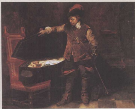
◎ 1649年1月30日，查理一世被处死在白金汉宫门前。这幅画描绘了行刑之后，克伦威尔检视国王尸体时的场面。

威廉三世患有肺结核和气喘病，脚有点跛，他的妻子、詹姆斯二世的长女玛丽也不是个理想的公主——虽然颇有姿色，