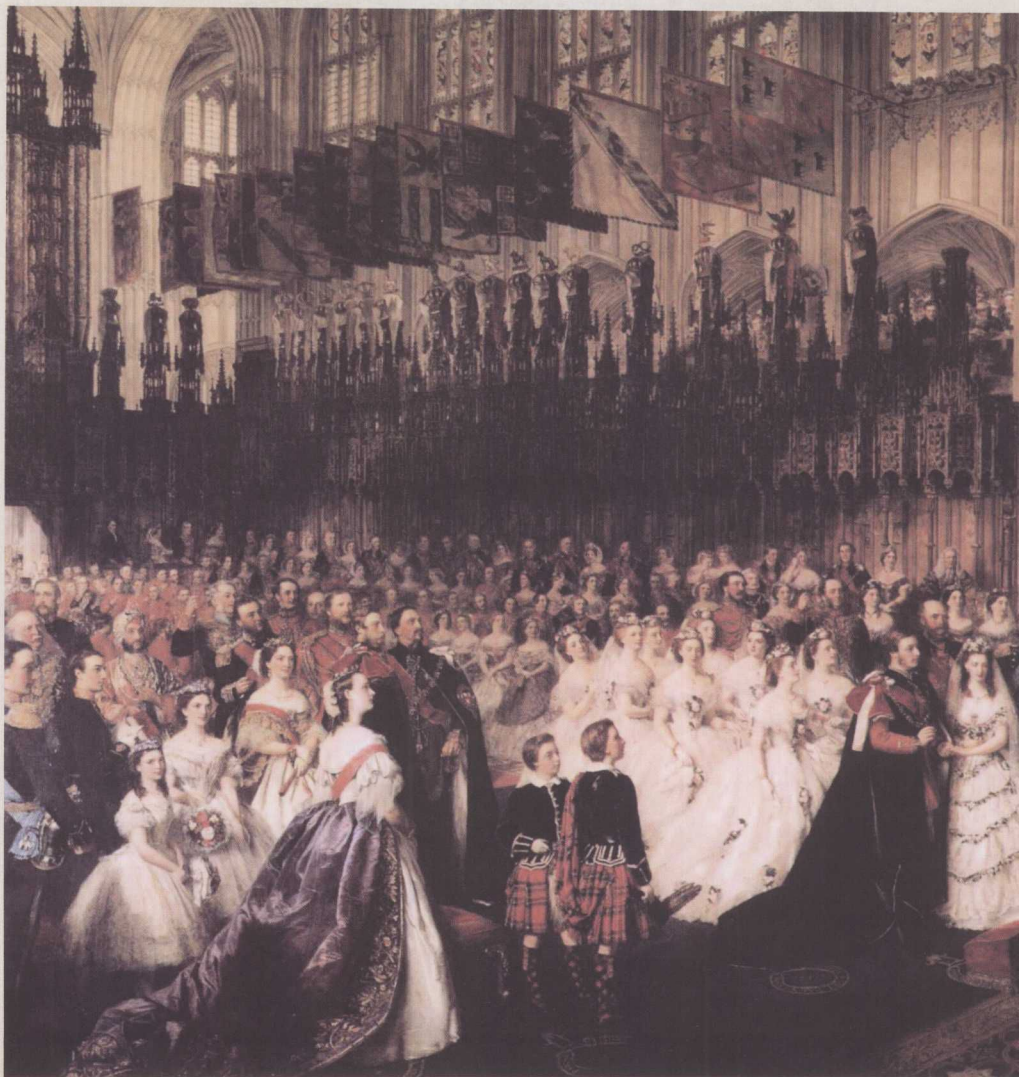
◎ 爱德华与亚历山德拉的婚礼