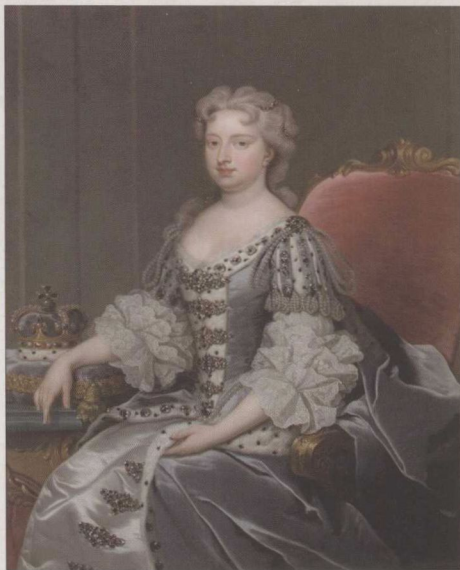
◎ 卡罗琳美丽又聪明，乔治二世非常爱她。卡罗琳体贴丈夫，也深知自己对丈夫的影响力。

卡罗琳一直患有疝气，经常肚子痛，还伴有呕吐。她试图对国王隐瞒此事，因为国王对疾病一向感到恐惧，不希望失去这个世上少有的顺从、体贴的妻子。然而，由于耽搁过久，王后的肠子已经穿孔了，外科医生必须动手术打开肚子，取出坏死