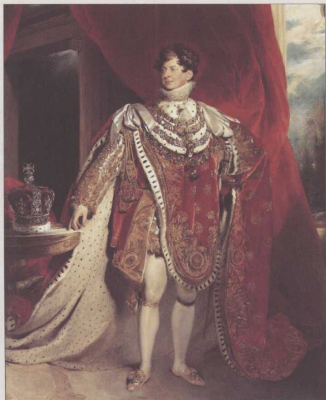
◎ 乔治四世是汉诺威家族中少见的才子，在文学艺术上颇有造诣，但英国的普遍民众十分反感他的放荡不羁。