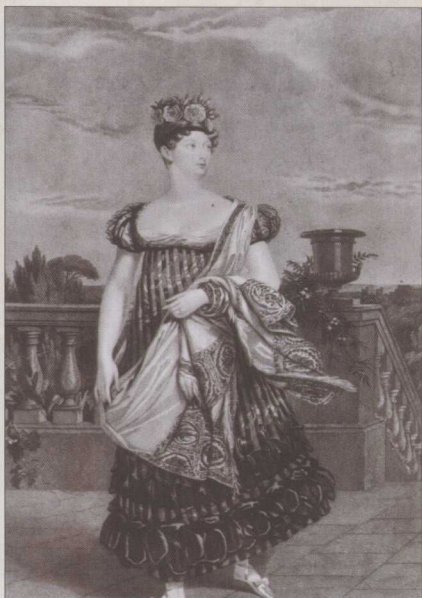
◎ 夏洛特公主受到英国民众爱戴，她死后人们为失去这位公主而感到惋惜。

乔治和卡洛林唯一的女儿夏洛特是个感情强烈的女孩，生性冲动。当她发现自己自私的父亲和怪癖的母亲结婚完全是为了继承王位，对自己没有一丝感情后，她与父亲形同路人。17岁时，父亲决定把她嫁给奥兰治亲王。起初她同意了，可是，她突然喜欢上了普鲁士的一位王子，乃决意解除婚约。但还在交涉时，她又爱上了萨克森-科堡的利奥波德亲王。1816年，婚典在伦敦举行。次年春天，公主有喜了。可是分娩时，夏洛特却死于难产，生下的男孩也是一个死婴。