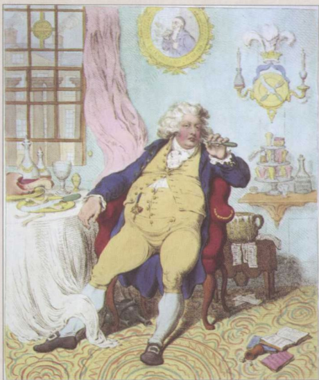
◎ 这是一副1792年的讽刺漫画，把乔治四世描绘成好吃懒做、沉迷酒色的纨绔子弟，身边尽是空酒瓶、残羹和各种药品，还有用便壶压着的账单。

是威尔士亲王乔治·奥古斯塔斯——未来的乔治四世。他在公开场合道貌岸然，背地里却无恶不作，不仅暴饮暴食、嗜酒如命，胖得像漫画中的怪物，而且，还到处沾花惹草、赌博欠债。国王经常责打这个不争气的儿子，有一次，他抓住儿子的衣领，把他从椅子上拎起来，用力摔到墙上。奥古斯塔斯顿时就哭了，但是很快就恢复了常态，利用父亲的病为自己谋求好处。