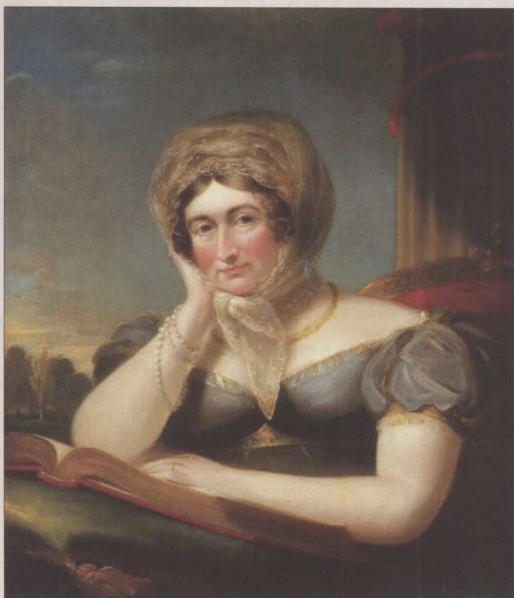
◎ 卡洛林公主1820年的画像。乔治见到卡洛林时曾大惊失色：“天哪！我不舒服，请给我一杯白兰地。”婚礼上，他更是烂醉如泥。