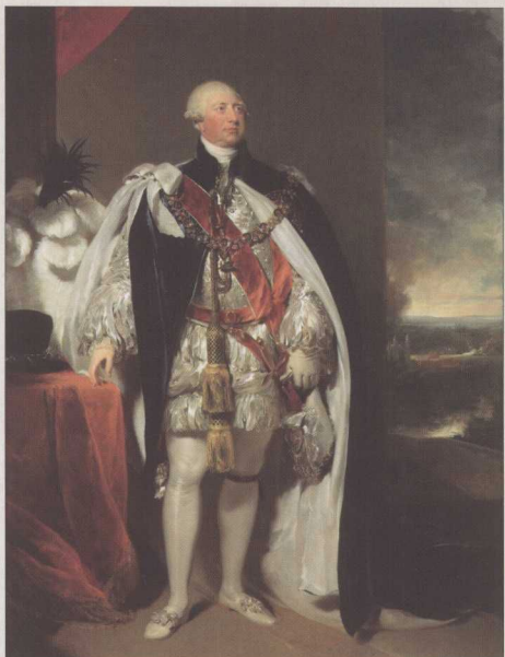
◎ 乔治三世在位59年，终年时81岁，当时这两个纪录超越了以前的历任英国君主。但多次的精神错乱为他的晚年笼罩上一层乌云。

在大多数正常的时候，乔治三世会谴责自己那群堕落的儿子们放荡不羁的生活。提起那群王子，纵使人称“铁公爵”的威灵顿也不禁满腹牢骚：“对任何政府而言，他们都是最沉重的包袱。”最让人烦心的