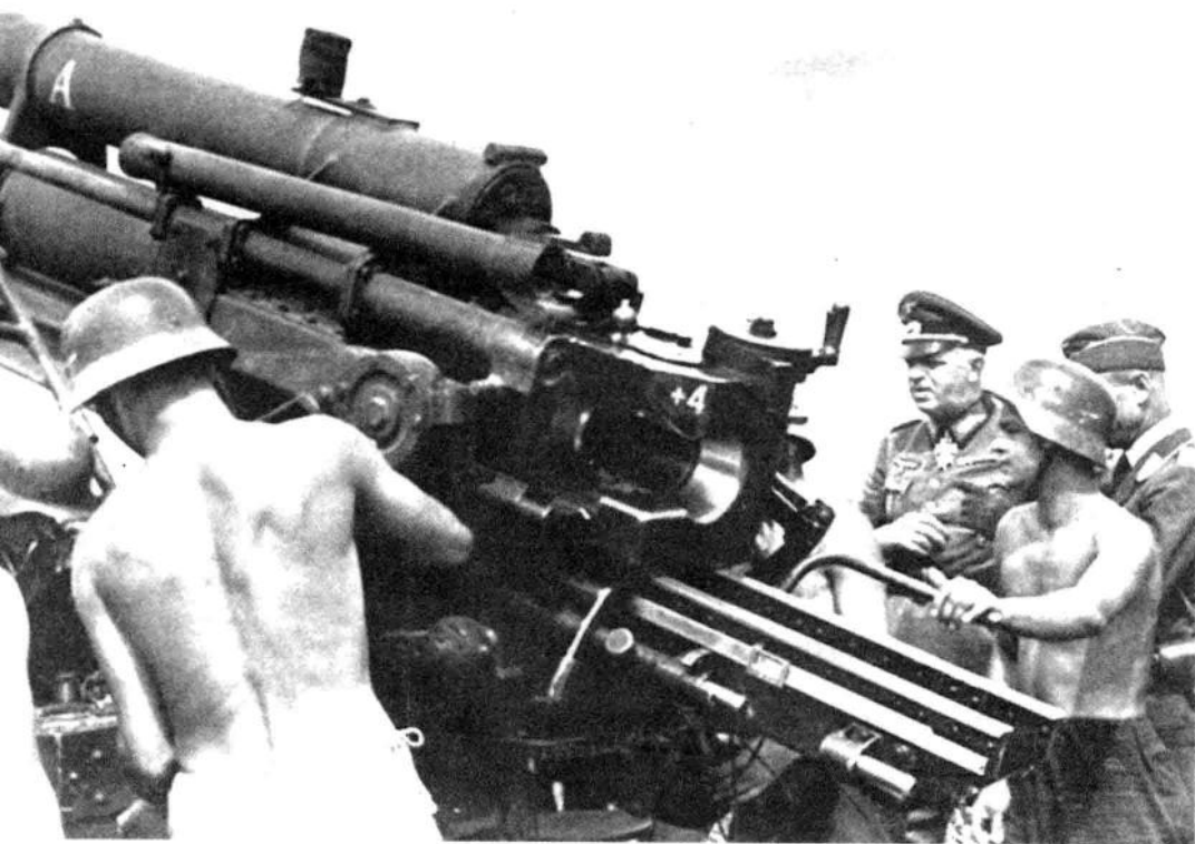
苏德战场上的德军高射炮阵地