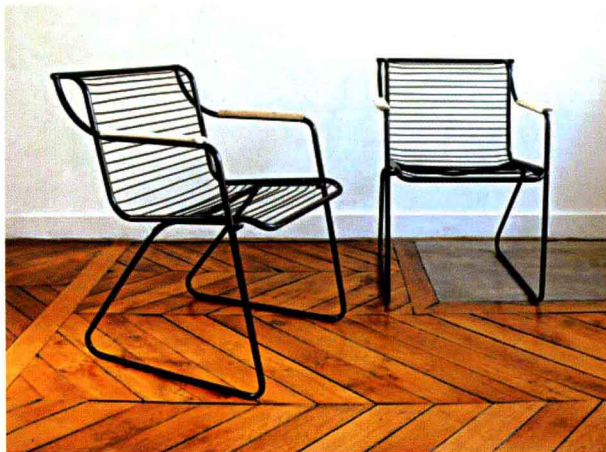
图8 该休闲椅既有造型的变化，又有材质和表现语言的统一。