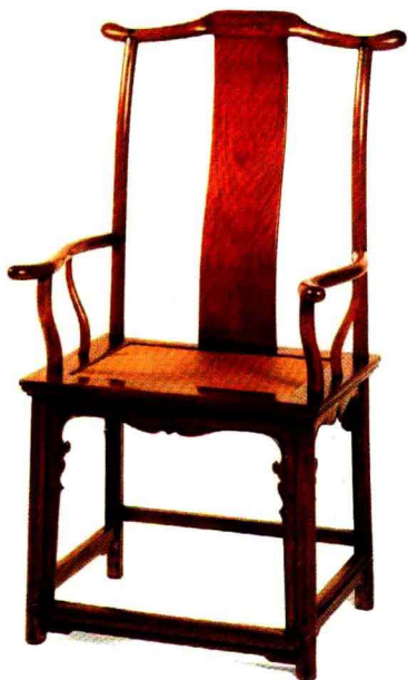
图7 明式四出头官帽椅。作为明式家具的典范之作。该椅整体浑然天成，和谐庄重。横平竖直的交接之间又有弧度自然的搭脑、靠背、扶手、联帮棍。线面处理得当，对比丰富，给人一种秩序感和层次感。