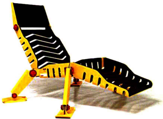
图6 金属件连接结构家具。