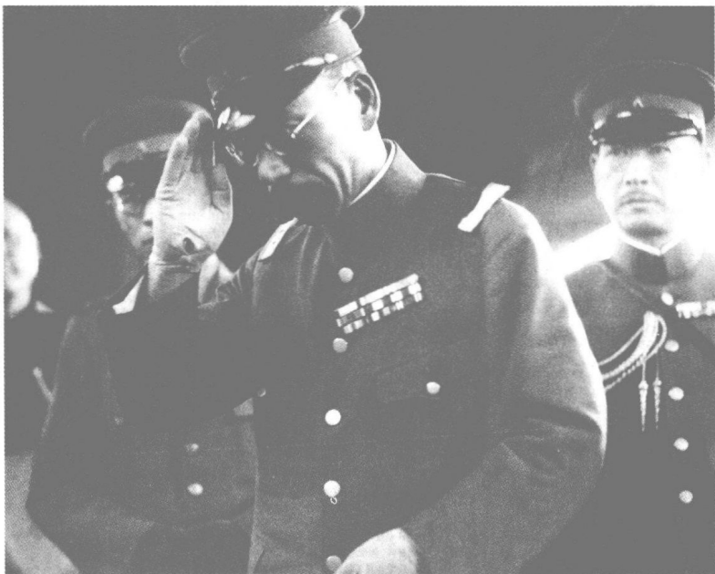
1936年春,日本开始增兵华北,图为田代皖一郎中将到津就任,成为军衔最高的日本华北驻屯军司令官。羽毛渐丰的华北驻屯军开始取代关东军成为侵华的急先锋。

二二六政变后上台的广田弘毅内阁完全听命于军部。1936年8月7日,日本在首相、外相、陆相、海相、藏相参加的五相会议上,通过了《国策大纲》,首次把北进和南进两个方面并列为基本国策。《国策大纲》提出“帝国当前应该确立的根本国策,在于外交和国防互相配合,一方面确保帝国在东亚大陆的地位,另一方面向南方海