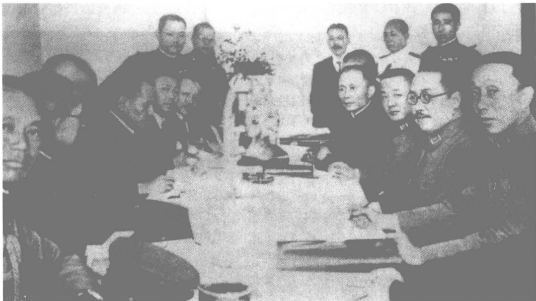
日军攻占冷口、滦东后，兵逼平津，迫使中国政府签订了《塘沽协定》，默认日本对东北、热河的军事占领，冀东作为缓冲区任由日军自由出入，华北门户洞开。图为中（右）日双方代表在塘沽会议上。

沽协定》，规定中国军队立即撤退至延庆、昌平、高丽营、顺义、通州、香河、宝坻、林亭口、宁河、芦台所连之线以西以南地区，不得越过该线，不得有挑战扰乱之行动。日军为确悉上述规定执行情形，随时可用飞机及其他方法进行观察，中国方面对此应加以保护及予以各种便利。日军在证实中国军队遵守上述规定后，不再越过该线追击，并自动归还至长城之线。长城线以南及上述规定之线以北以东地区的治安维持，由中国警察机关担任，但不得用刺激日军感情的武力团体。这个协定，不仅事实上承认了日本占领东北3省和热河的合法性，而且将冀东各县划为日军可以“自由行动”而中国军队不能进入的“非武装区”，中国军队则退至北平、天津附近。这样，就置华北于日军监视和控制之下，为日本攻取北平、天津，进而夺取整个华北打开了方便之门。