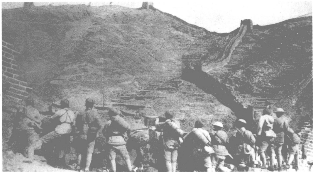
1933年3月,日本侵略军进犯长城各关口。驻守喜峰口的国民党第29军英勇抵抗。图为中国军队在喜峰口与古北口之间的罗文峪布防。

6 日本侵吞中国东北3省后,按既定计划发动对华北的进攻。1933年1月初日军攻占山海关,3月侵占了热河全省,接着向长城一线进犯。国民党第29军、第32军、第17军和东北军一部在长城之喜峰口、冷口、古北口等地进行了英勇抗击。但是,由于蒋介石推行“攘外必先安内”政策,集中力量“围剿”中国工农红军,不向长城防线增援,致使守军在日军的疯狂进攻下于5月中旬放弃长城防线,河北省东部20余县遂陷入敌手。5月31日,南京国民政府与日本达成了出卖领土主权的《塘