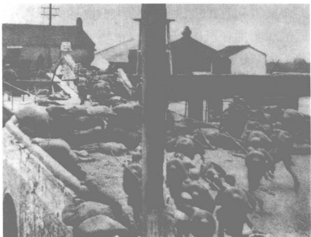
驻守上海的国民党第19路军3万余爱国官兵在蒋光鼐、蔡廷锴率领下,英勇抗击日本侵略军。图为第19路军士兵在追击逃窜的日军。

1932年1月28日,日军对上海驻军发动军事进攻,制造了一·二八事变。在国民党爱国将领蔡廷锴、蒋光鼐和张治中的指挥下,国民党第19路军和第5军等部队进行了英勇的抵抗,打退了日军的连续进攻。日军死伤逾万,并三易主帅。然而,国民党蒋介石政府决意对日妥协,不向上海增派援军,致使第19路军和第5军在优势敌军进攻下被迫撤离上海。5月5日,南京国民政府与日本签订了丧权辱国的《淞沪停战协定》,承认日军可以留驻上海,而中国军队必须撤离上海且不得在上海周围地区驻防,并取缔抗日活动。