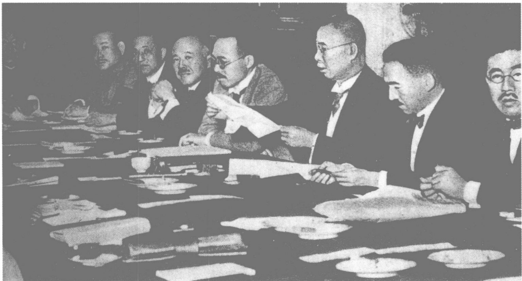
日本帝国主义独占中国的图谋由来已久。图为1927年6月27日至7月7日日本田中内阁召开的“东方会议”。会议确定了把“满蒙”同“中国本土”分离开来的方针,制定了先征服“满蒙”,再征服“支那”的计划。右起第3人为日本首相田中义一。

此乃明治大帝之遗策,是亦我日本帝国之存立上必要之事也……考我国之现势及将来,如欲造成昭和新政,必须以积极的对满蒙强取权利为主义。以权利而培养贸易,此不但可制支那工业之发达,亦可避欧势东渐,策之优,计之善,莫过于此。我对满蒙权利如可真实的〔地〕到我手,则以满蒙为根据,以贸易之假面具风靡支那四百余州;再则以满蒙之权利为司令塔,而攫取全支那之利源。以支那之富源而作征服印度及南洋各岛以及中小亚细亚、欧罗巴之用,我大和民族之欲步武于亚细亚大陆者,握执满蒙权利乃其第一大关键也。” ①