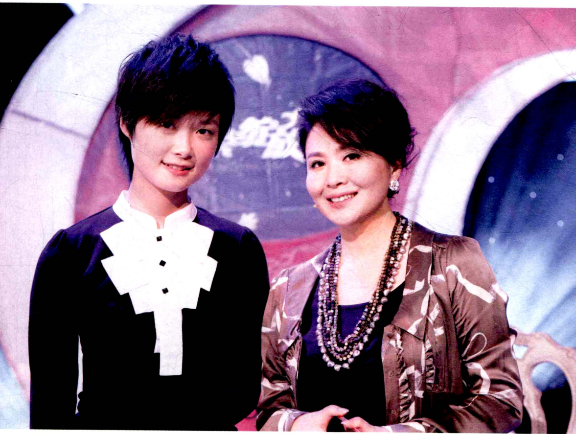
“中国流行文化代表”李宇春与主持人田歌