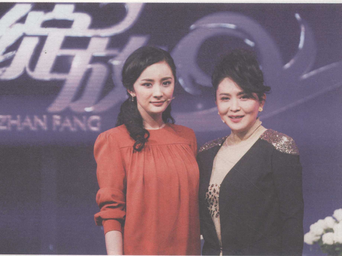
80后新生代娱乐明星杨幂与主持人田歌