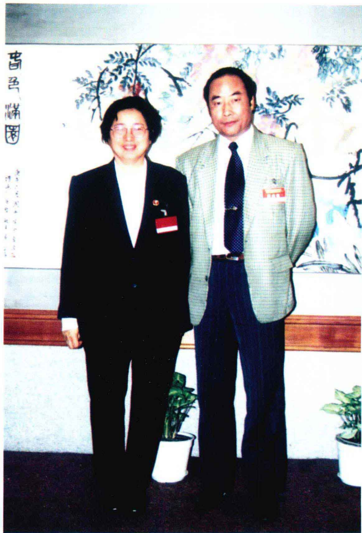
1997年11月24日，陈天谷参加民革全国第九次代表大会，与全国人大常委会副委员长、民革中央主席何鲁丽合影。