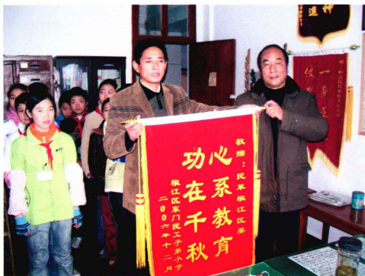
2006年12月，椒江区东门民工子弟小学赠送锦旗，寄言“心系教育功在千秋”，感谢民革椒江区委对他们的关怀。