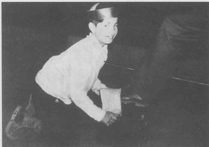
“你永远都不要忘记自己是从哪里来的。”乔·吉拉德9岁在酒吧里当擦鞋童