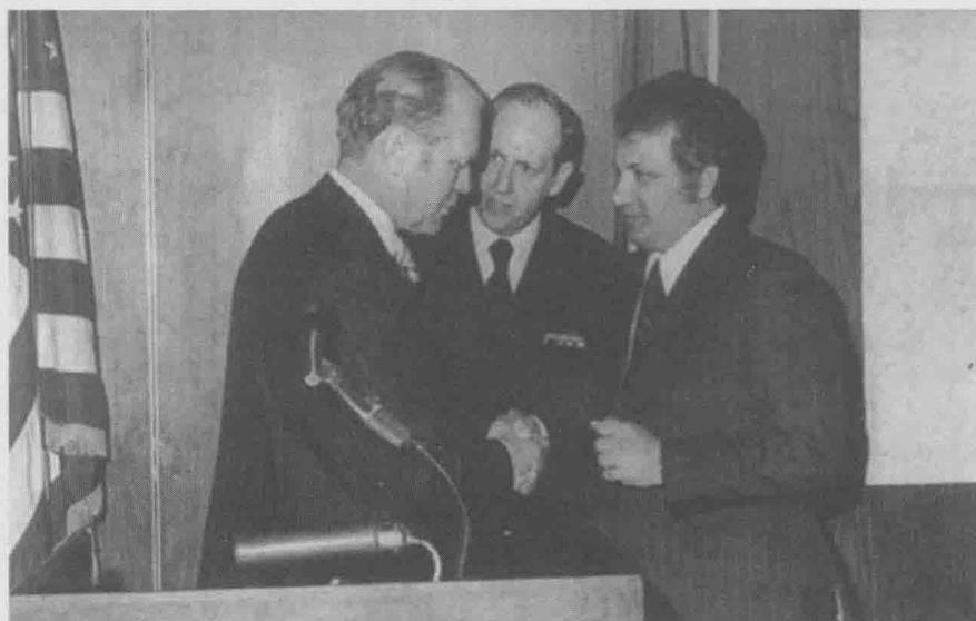
乔·吉拉德（右）受到美国第38届总统杰拉尔德·R·福特（左）的接见