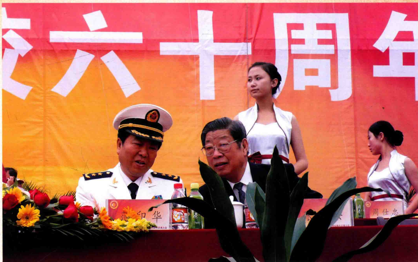
海军副政委范印华中将和原陕西省委书记张勃兴参加校庆60周年庆典