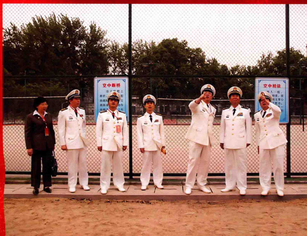
2009年5月，海军副政委范印华中将一行在校党委副书记杨萍陪同下视察我校国防生训练场。