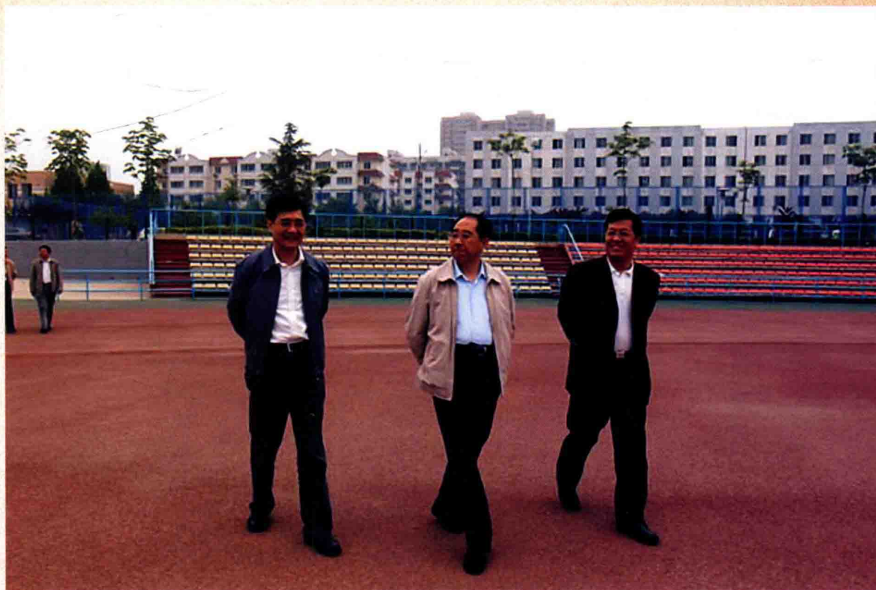
2009年4月，陕西省副省长郑小明（中）在校党委书记周孝德（右）和校长刘丁（左）陪同下视察我校体育场地。