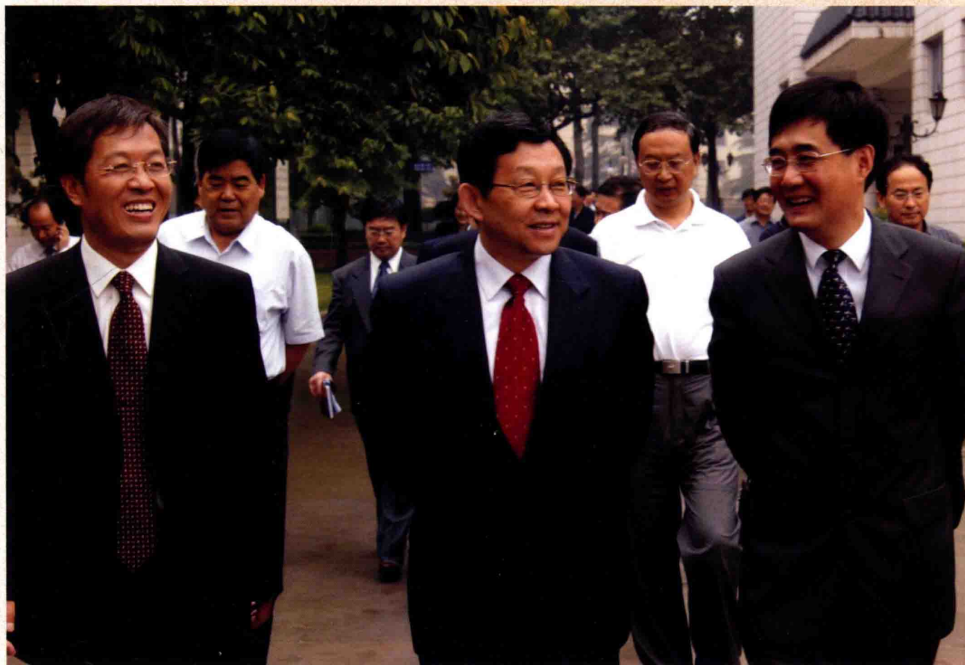
2006年5月陈德铭省长（现任商务部部长）来校视察