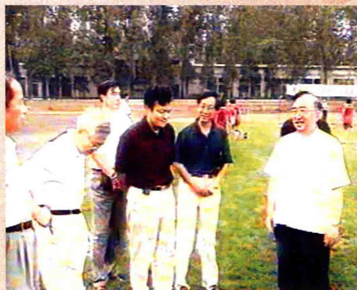
1999年国家体育总局局长伍绍祖来我校视察