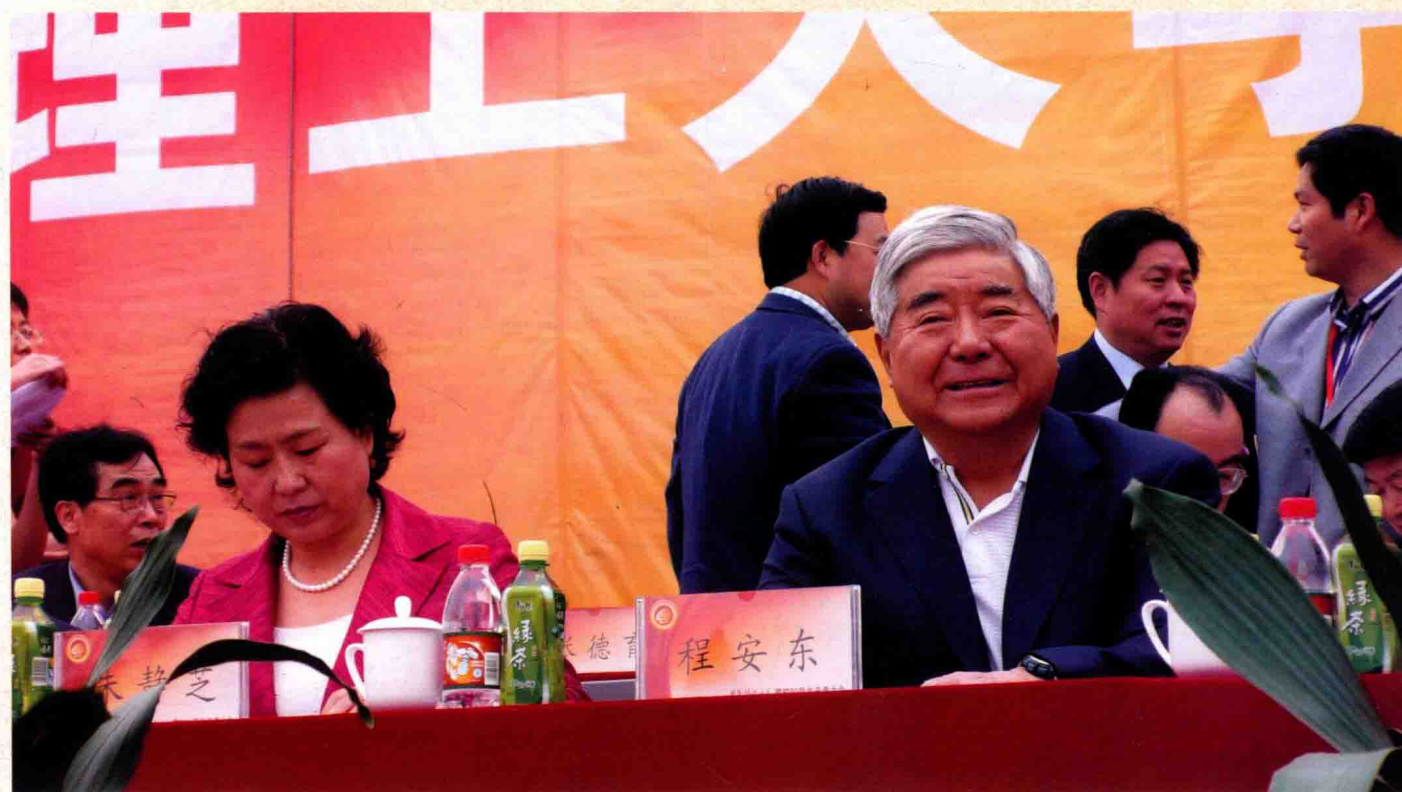
副省长朱静芝和原陕西省省长程安东参加校庆60周年庆典