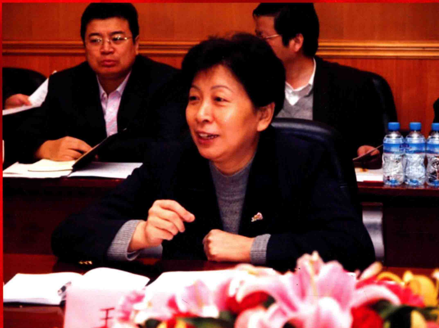
2009年省委副书记王侠来我校视察