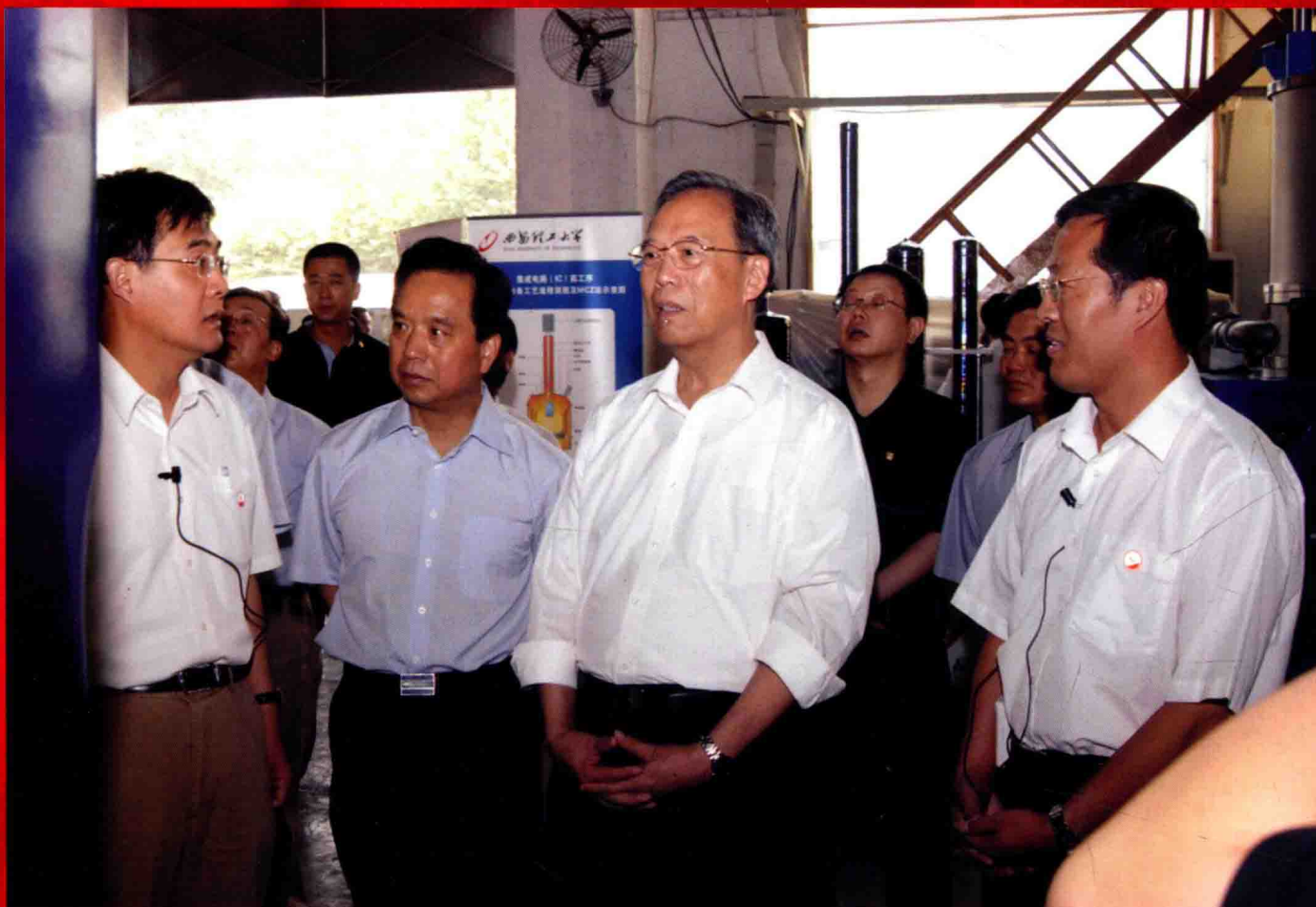
2006年国务院副总理曾培炎在陕西省委书记李建国陪同下来我校视察