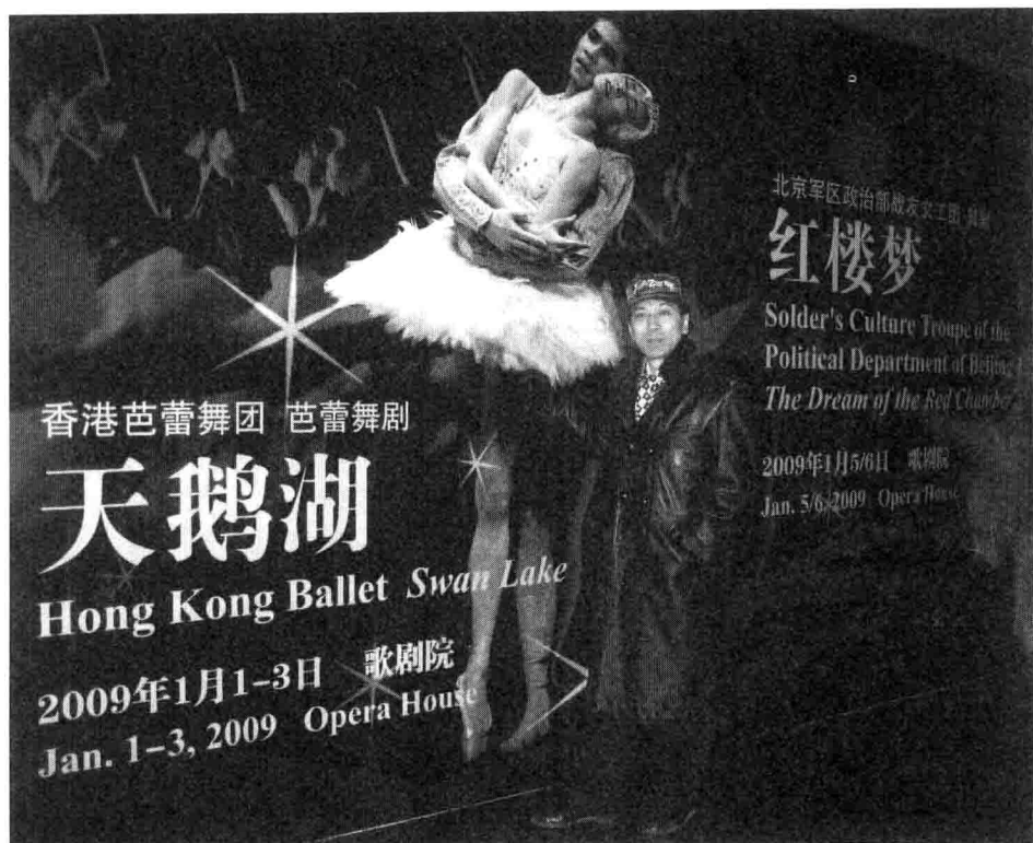
在北京国家大剧院看芭蕾