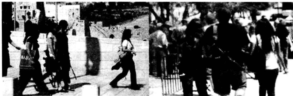
图 1-2 以色列街头随处可见携带武器的保安

私人保安在以色列各地随处可见。无处不在的保安为大众增添了一份安全感。大多数以色列保安是 30 岁以下的年轻人，因为以色列保安的需求量大，很多找不到工作的年轻人都投入到保安的行业，一些大学生也在假期当保安挣学费，很多女性也加入到保安的行业。此外还有一些 50 岁左右的男人、单身母亲或退役老兵当保安谋生（图 1-2）。金融危机使得以色列的失业率达到了 11%，打开招聘广告，能找到的工作只有当保安。