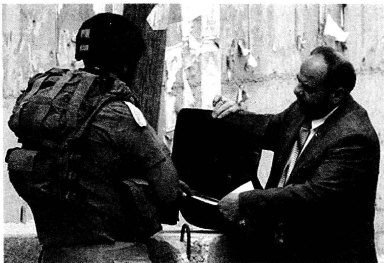
图 1-1 以色列安保人员穿着防弹服在检查巴勒斯坦人