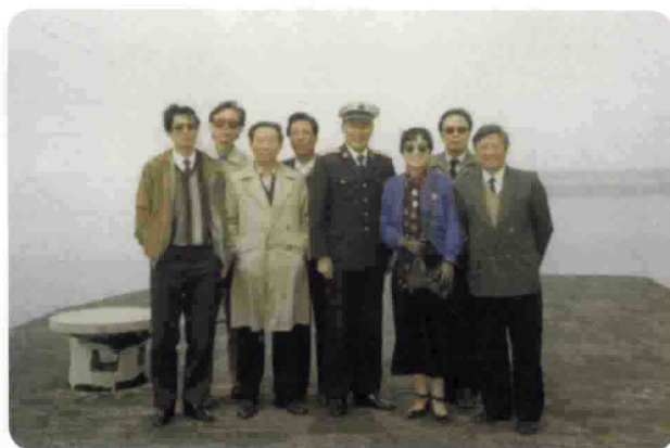
与省内部分词曲作家在胶南市采风合影。1992