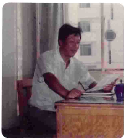
在音乐研讨会上宣读论文。1991