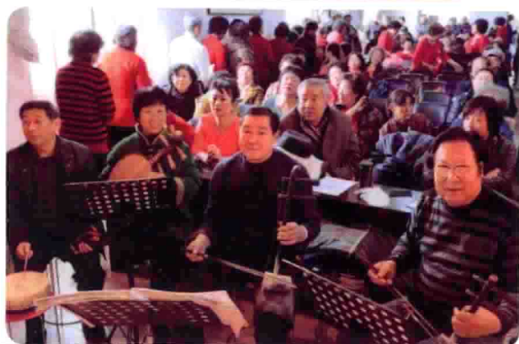
为李沧区老年大学演出 京剧伴奏。2011.12