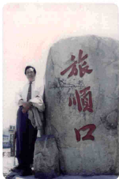
借调大连市吕剧团工作时留影。1981