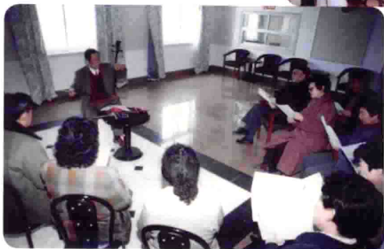
为青島市李沧区 老年大学授课教唱吕 剧。2001.3