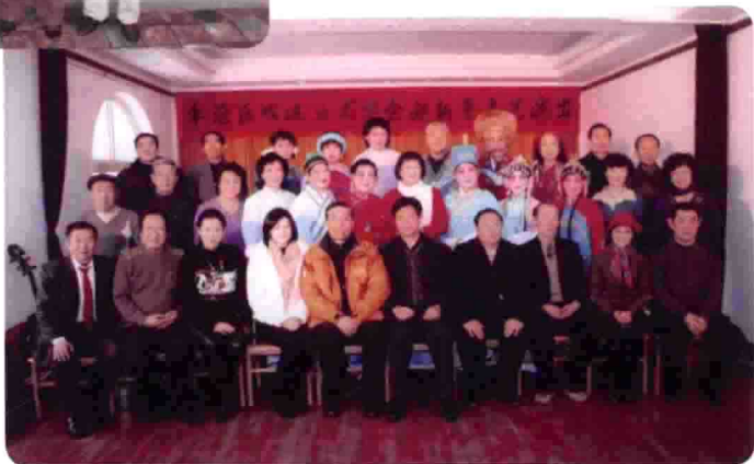
与部分老年学 生及领导在青 岛市李沧区戏 迷协会迎新年 文艺晚会上。 原市文联主席 李恺心（一排 右五）、原市 艺术处处长赵 鲜令（一排右 二）、李沧区 文化馆馆长吴 娟（一排右三）合影