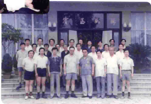
青島市音乐研讨会合影。199.3