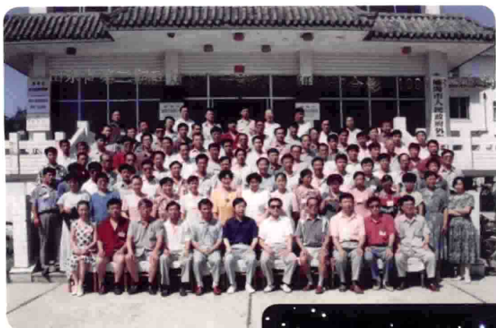
山东第二期 全省群众文化干部 理论研讨班合影。 1995