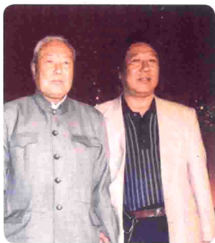
与著名作曲家唐诃先生在一起。1998