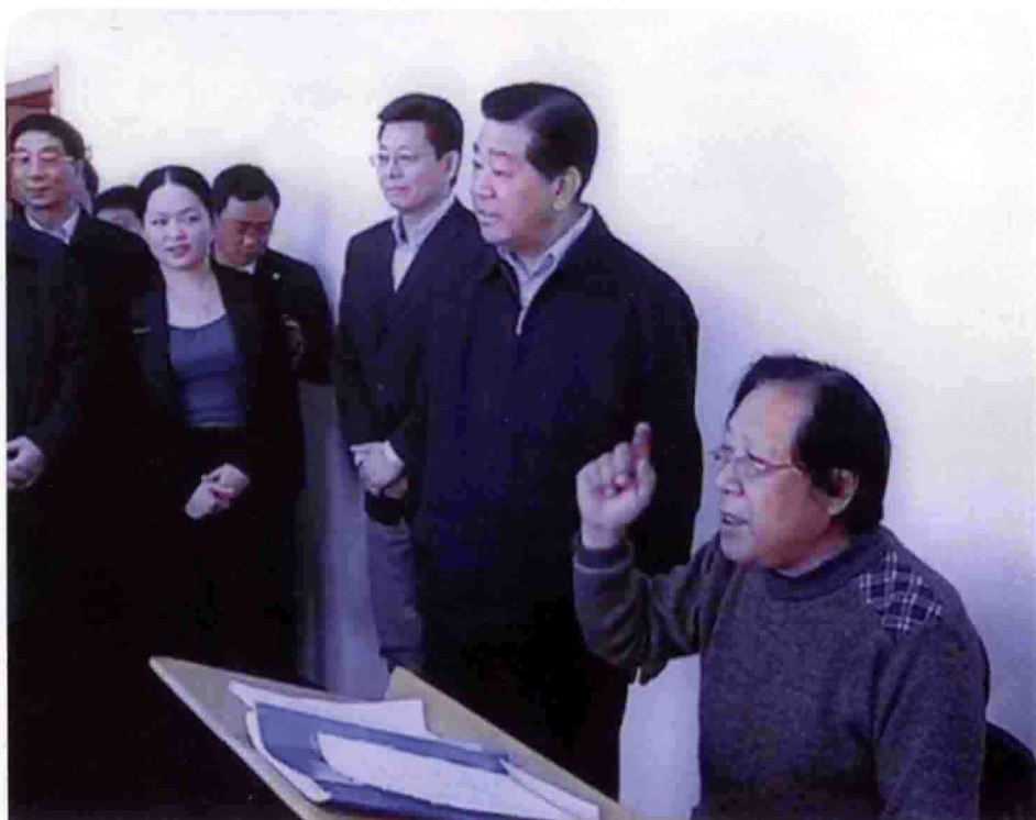
中共中央政治局常委、国家政协主席贾庆林 2012 年 3 月 27 日来青 岛市视察城阳区老年大学作者为学员们授课，中央电视台 3 月 29 日新闻 播出。