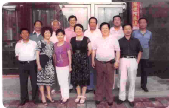
相见时难 与第二故乡吉林省柳河吕 剧团部分老同事合影。2009