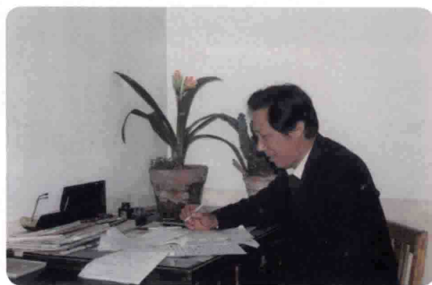
在认真的进行创作。1993