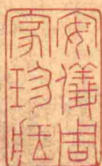
【三吳帖】敬謹以鄙詩送、提舉通直使江西。