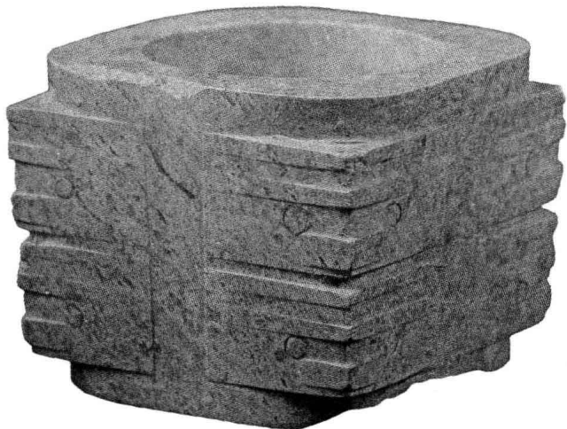
玉琮 良渚文化 南京博物院藏

(1892)，授湖南巡抚，设求贤馆。中日甲午战争爆发，自请率湘军赴辽抗日，大败于牛庄，被革职留任。光绪二十四年（1898），又被革职永不叙用。以风疾卒于家。