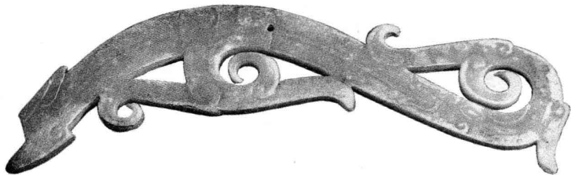
龙形玉佩 战国早期 河南省 方舟研究所藏

其次，绘图精确，标注翔实。书中收录的为吴氏本人及友人所藏古玉，图由其族弟吴大桢所绘。以墨线描绘玉器的形状和花纹，非常精确，若是同一器物而两面花纹不同，则绘两图表示。线图比例多为原大，否则在图旁注明比例。如本书图3（正文第13页）“镇圭”，并注明图的尺寸“图小，于器十分之七”，测得长16.7厘米。此器现藏于英国大英博物馆，实测器长23.8厘米，与“图小，于器十分之七”的16.7厘米正相符合。又如本书图148（正文第148页）“龙文佩”为战国时期的龙形佩，现藏美国哈佛大学赛克勒博物馆，其尺寸为长15厘米、宽5.5厘米，厚0.7厘米，重97公克，与吴大澂所描绘尺寸完全相符，可见吴氏兄弟审视、绘制古玉的务实精神。需要说明的是，本次出版，由于篇幅的关系，这些线图的大小没有完全依照原有大小排版，原文所言的尺寸，多多少少都经过调整。另外，原书不分卷且无标题，为使眉目看起来更清晰，此次皆以所列同类器物之第一器名为标