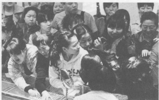
2013年4月16日，“中国大妈”踊跃购买黄金