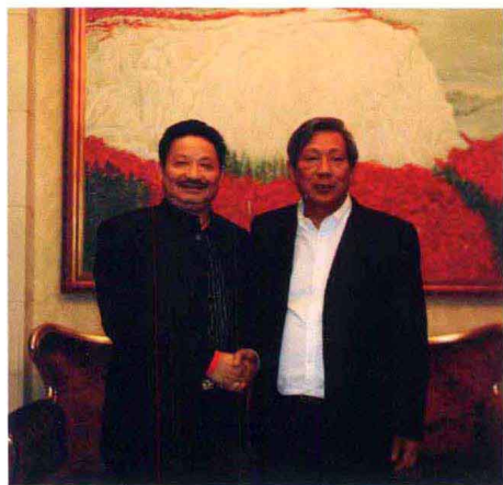
卢天明与泰国副总理披尼合影