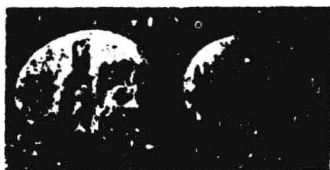
小亚西亚 吕底亚人铸币