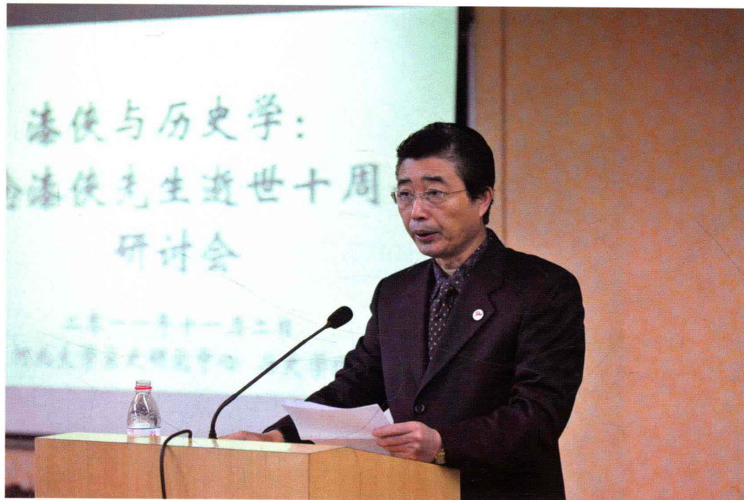
河北大学党委书记、校长王洪瑞讲话