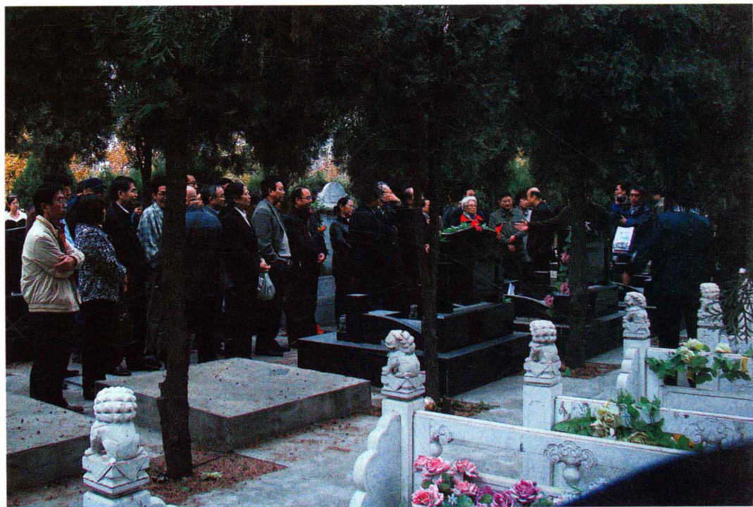
与会师友在漆侠先生墓前