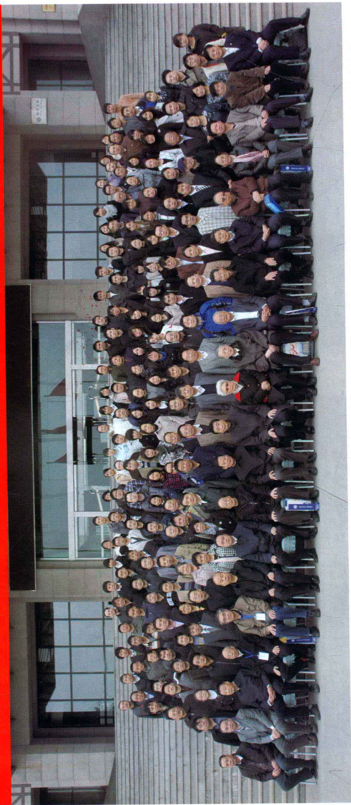
“漆侠与历史学：纪念漆侠先生逝世十周年研讨会”合影