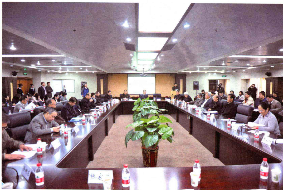
纪念漆侠先生逝世十周年学术研讨会会场