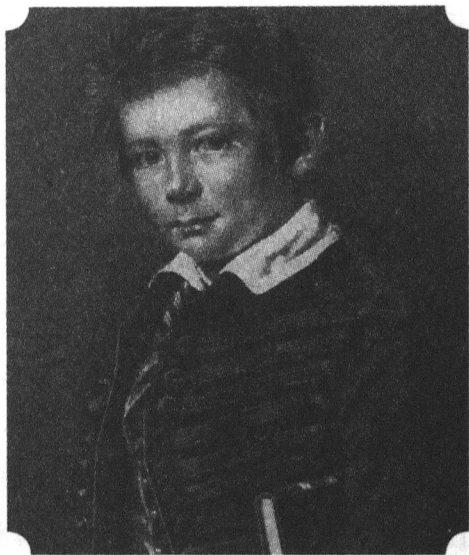
少年时期的俾斯麦

俾斯麦的同学莫特利曾出版过一本名为《奥托·冯·雷本马克》的小说，在小说中，他用生动的笔触描写了这个时期的俾斯麦。他是这样写的：“他很年轻……应该还没到17岁，但他很聪明……比我所见过的所有人都聪明。……我几乎没见过像他这样面目可憎的人……但我和他相处了很长时间……起初，我觉得他的长相还说得过去。他头发凌乱，颜色很杂，介于红白之间，略带橙色，脸上满是雀斑，两眼的中心没有颜色，好像有一圈红线围绕在他的双眼旁边。他的脸上有一大块伤痕，