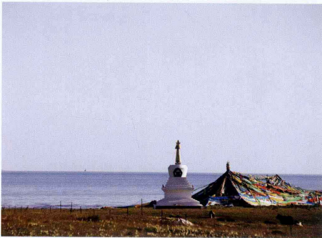
▲ 象征佛教的彩色经幡和如来塔。

蓝天白云下，众多河流流过湖边草甸，牧民赶着牛羊在草原上走过，人与自然的宁静让整个青海湖之春显得更加动人。