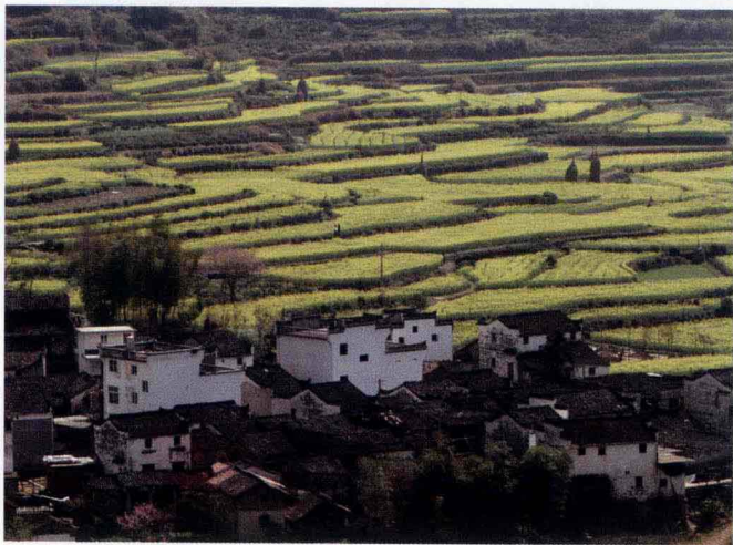
▲ 散落山野的白墙青瓦与周围环境相得益彰，构成了一幅和谐美丽的乡村油画。