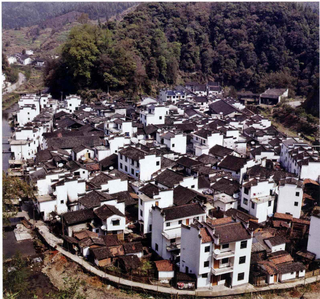
▲在婺源，徽派民居早已成为当地的建筑主调，青山绿水间糅合些许灰白水墨，统一不失单调。