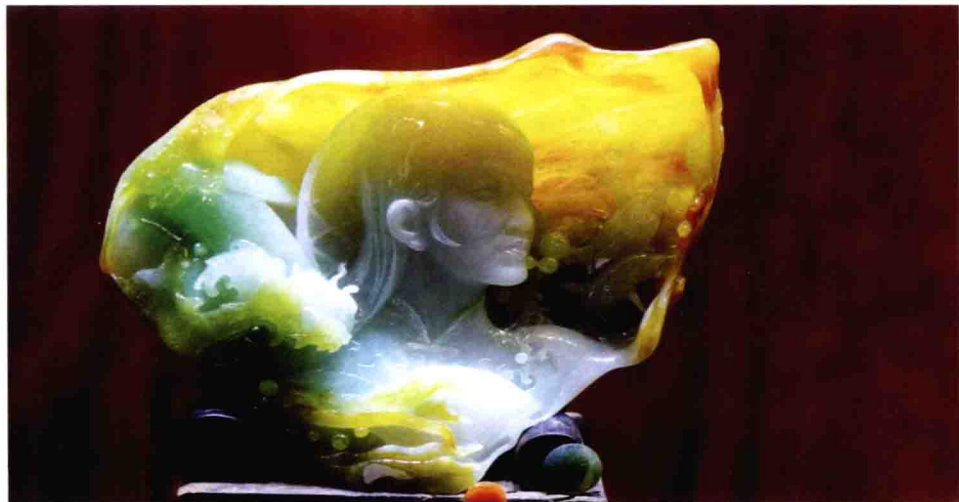
海之韵（翡翠雕件，王朝阳）

爱玉、赏玉、敬玉和藏玉的情愫，必将随着中国文化的继承和发扬光大而世代相传。（2012-08-01）