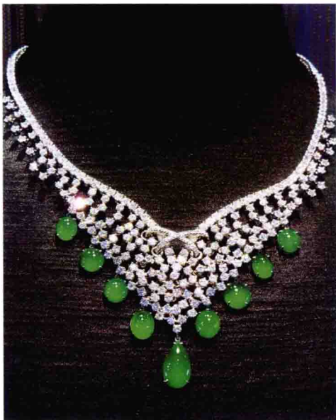
碧绿欲滴（翡翠项链）

玉之美的人格化，表达了正义的事业、高贵的气节、优良的品格，以及对生活美好的信念和理想。如今在人们的心目中，玉成了人生修养、高尚品格、美好愿望、完美形象和自身良好情绪及情操的载体，中国人爱玉敬玉之习俗绵延不断，流传不息。人们对玉总是有一种特殊的情愫，在日常生活和人际交往中会用玉来寓意喜庆与吉祥、预祝福寿和富康、表示坚贞与忠诚、象征文雅和永恒。