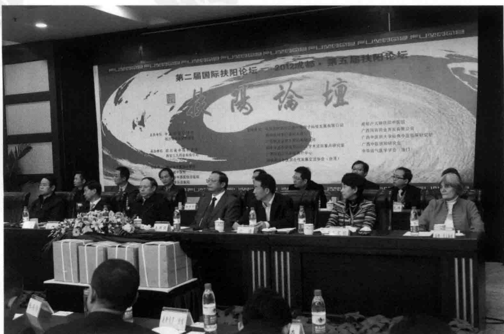
▲第二届国际扶阳论坛暨第五届扶阳论坛会场