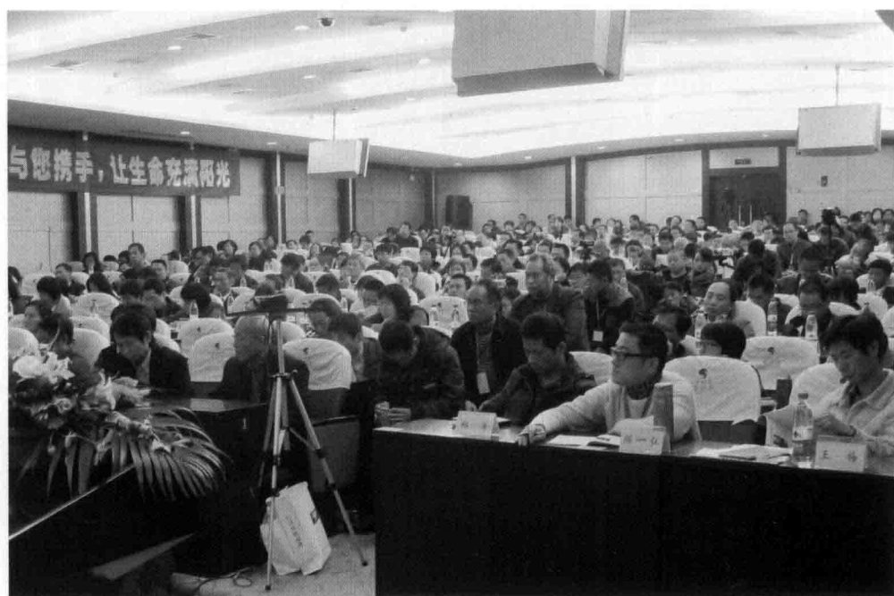
▲扶阳论坛会场座无虚席