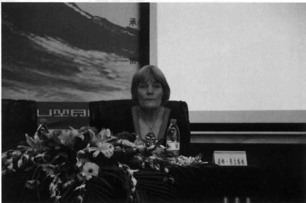
▲诺娜·弗兰格林教授在做主题演讲