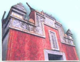
山隴白馬尊王 ▶ p85