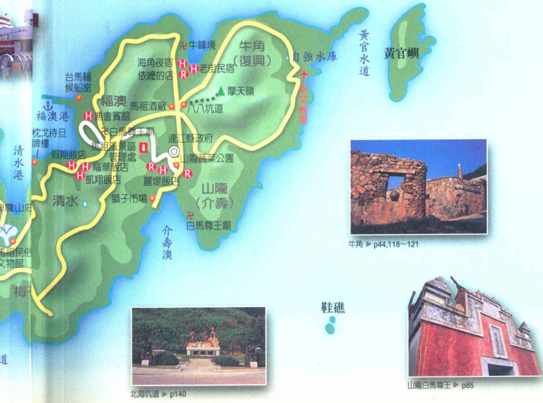
牛角 ▶ p44, 118~121