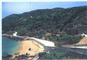
芹壁 ▶ p36~65