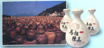
馬祖酒廠 ▶ p114