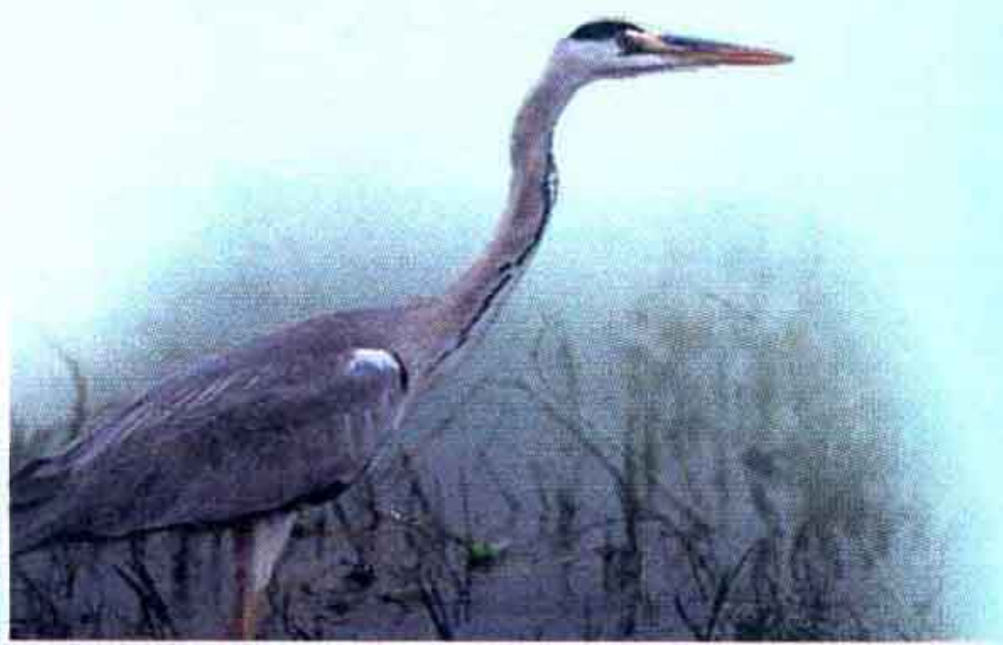
蒼鷺 ▶ p82~85