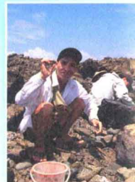
永留嶼 ▶ p5