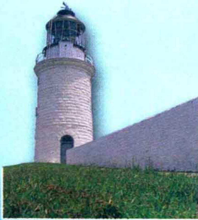
東莒燈塔 ▶ p132