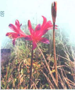
賞花 ▶ p106