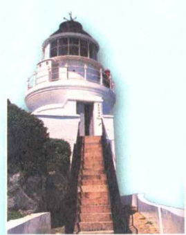
東引燈塔 ▶ p130