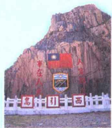
人定勝天 ▶ p138