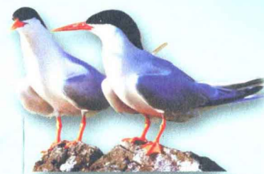
紅燕鷗 ▶ p76