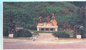
北海坑道 ▶ p140

落日的好地方，涼風徐徐，充滿詩情畫意。晚上，只要避開村落和大馬路的燈，比如雲台山或摩天嶺等，都是觀星的好地方，尤其是無雲的夏日，滿天銀河星斗，煞是浪漫。