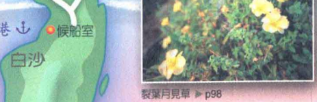
製葉月見草 ▶ p98