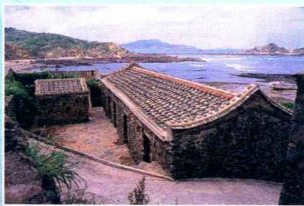
福正村 ▶ p44