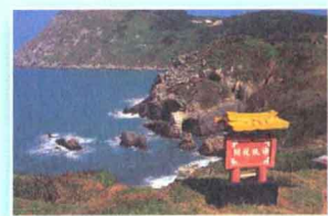
海現龍關 ▶ p86