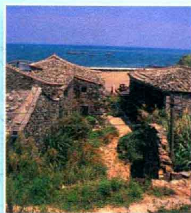
福正村 ▶ p44