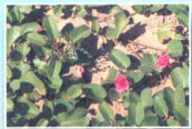
馬鞍藤 ▶ p98