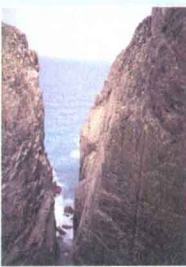
烈女義坑 ▶ p86