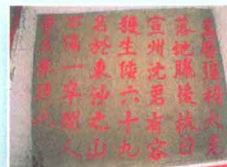
大埔石刻 ▶ p30