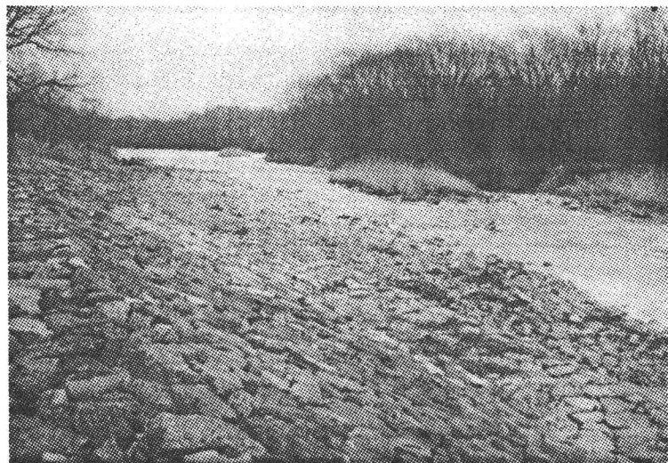
东宁地区的中俄界河瑚布图河

从 19 世纪末开始，沙俄与日本为了争夺中国东北进行了大规模的厮杀，最后以瓜分中国东北的势力范围而暂告结束，但是互相敌视的状态并没有改变，日本时刻提防沙俄的报复，并觊觎沙俄的远东地区。