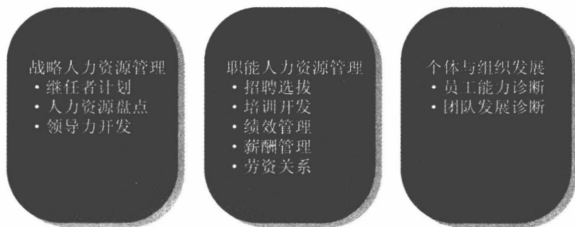
图1-4 人才测评是人事决策的重要工具

十多年前，很多人力资源管理者认为，测评仅仅能够在人才选拔中发挥作用。今天，测评已经成为很多企业人事决策的重要工具，在战略人力资源管理、职能人力资源管理和个体与组织发展这三个层面发挥着关键作用（见图1-4）。