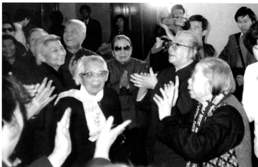
1988年，在陕甘宁妇联50周年纪念活动留影 右起：邓颖超、康克清、徐明清、帅孟奇、张邦英、曾志