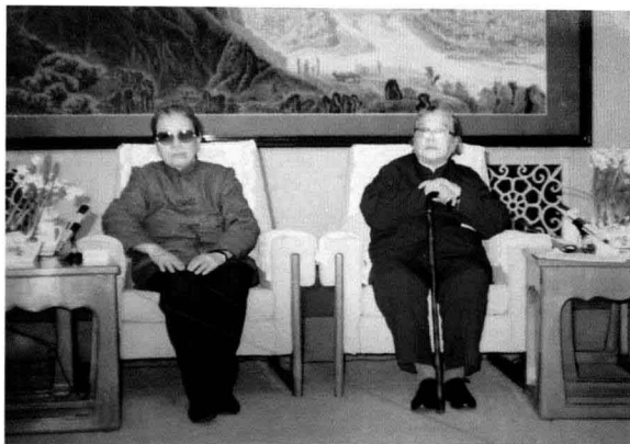
1988年，徐明清与康克清（右）合影