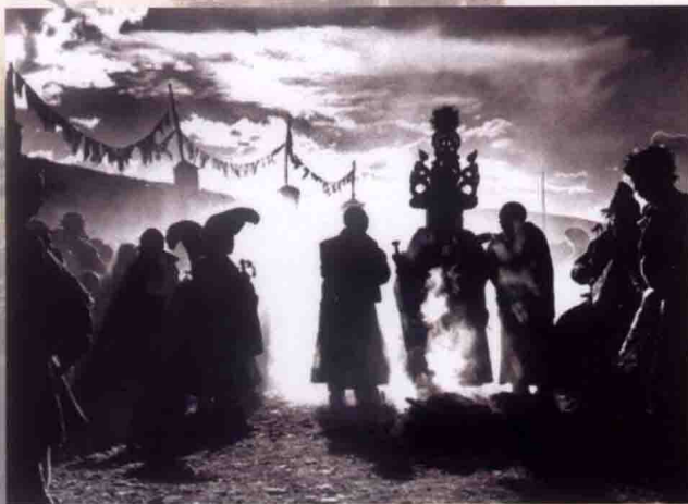
口口相传年代的信息传递

诗歌的精髓在于其创造的意境，善读诗的人也会领略意境所营造的弦外之音、味外之味，这也是这种艺术形式的奥妙之处。在动画作品创作中简单叙述剧本、罗列故事的方式显然并不精彩，利用视听元素合理排列创造意境，抒发情感才是蒙太奇的精髓所在。蒙太奇的手法犹如音乐，美妙的音符与观众产生共鸣和震撼使动画作品美轮美奂、熠熠生辉。