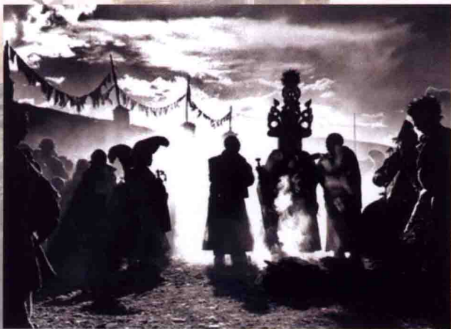
口口相传年代的信息传递

诗歌的精髓在于其创造的意境，善读诗的人也会领略意境所营造的弦外之音、味外之味，这也是这种艺术形式的奥妙之处。在动画作品创作中简单叙述剧本、罗列故事的方式显然并不精彩，利用视听元素合理排列创造意境，抒发情感才是蒙太奇的精髓所在。蒙太奇的手法犹如音乐，美妙的音符与观众产生共鸣和震撼使动画作品美轮美奂、熠熠生辉。