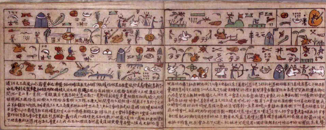
东巴文化的象形语言

分镜头将一种文体转化为另一种文体，在这个转换过程中，导演要面对两种语言体系，有些共通的可以保留，有些在转化过程中是必须放弃的，比如文学性、介绍性的描述。分镜头时要综合考虑剧本主题、人物性格和意境等因素。在一部动画片的创作及制作的全过程中，动画分镜头设计是体现动画片整体画面风格、控制节奏、框架逻辑的重要环节。在这其中，画面运动直接影响了镜头的整体感，而镜头的画面衔接更是需要转场的技巧，这一切都需要一个好的前期分镜头设计。分镜头的好坏直接影响了整部动画片创作的成功与否，决定了整部影片的表现语言和节奏。其实动画分镜头脚本相当于图画版的文字剧本，它不仅在前期中确定镜头的运动轨迹，还有景别以及人物的运动动作等。也附录有部分必要的文字说明和对话与旁白。分镜头脚本全面没有问题的话后续的动画制作会相对地轻松很多，也会减少犯错和出现做白工的现象，提高动画创作效率和叙事、表意的精确度。