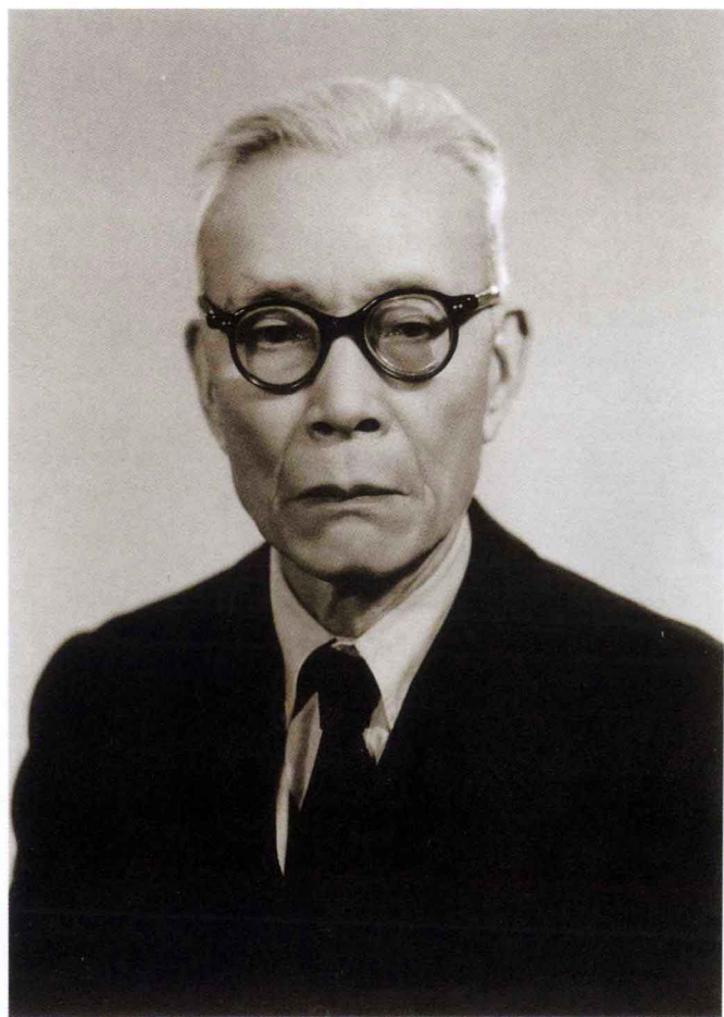
金 岳 霖