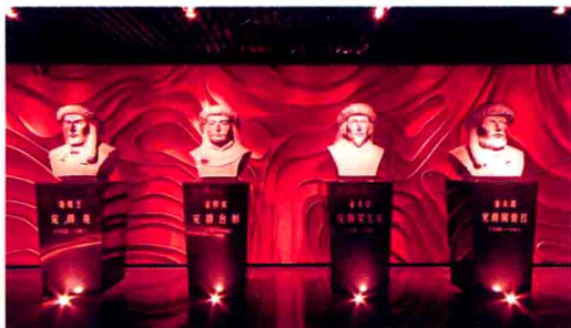
金初四位皇帝大理石雕像

● 金初四帝 金代在金上京为帝的四位皇帝即完颜阿骨达、完颜吴乞买、完颜合剌、海陵王完颜亮。这四位皇帝是金上京 38 年政治舞台的主人公,也是金上京历史博物馆基本陈列的胆和魂。