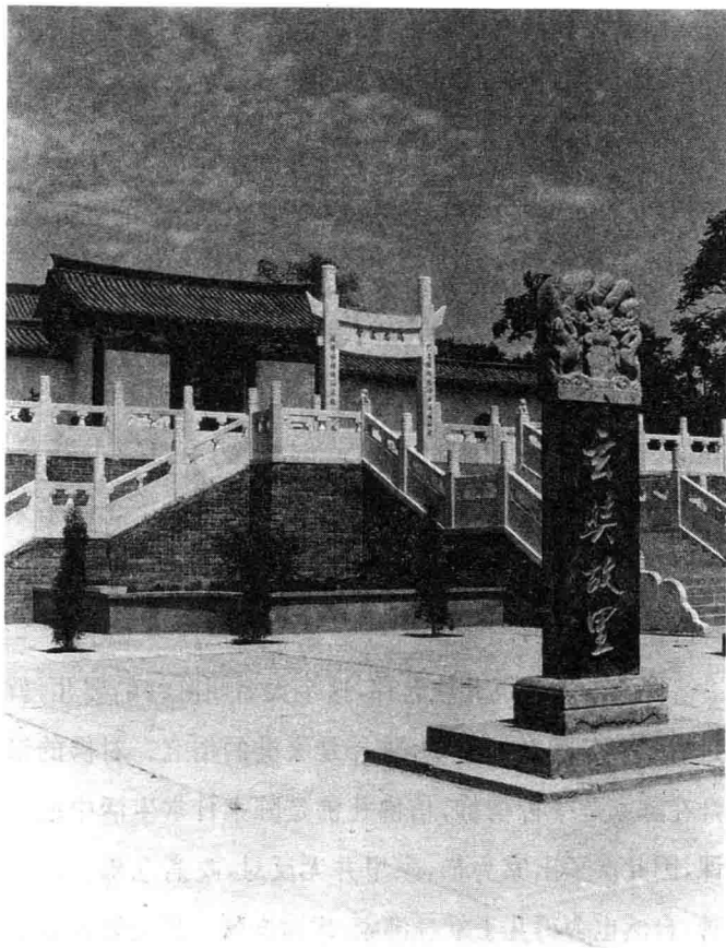
玄奘故里——河南偃师市缙氏镇陈河村