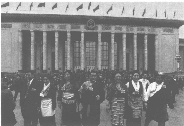
全国人大、政协“两会”，历来是中国和各国媒体聚焦的热点。

各地刚刚出现生机的公厕建设局面发生动摇。果真如此，中国百姓期待已久的“公厕梦”将倒退20年！