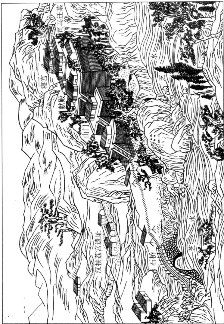
(二) 司马迁祠、墓 (据清乾隆《韩城县志》临摹)