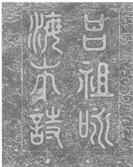
李承勋“吕祖咏海市诗”碑碑额

该诗作于明万历二十一年（1593年）。旧时人们通过扶乩来占卜吉凶祸福，在扶乩中，由神明下降题写的诗文称为扶乩诗。该诗为作者令其子通过扶乩而得到的吕祖“咏海市诗”。诗中在对海市的描写上，运用佛教“三千界”与道教“十二重”等用语，将海市描绘的既宏大又深邃。因借助了吕祖的威望，作者自视该诗为“绝唱”，早就心存将该诗勒石刻碑，助胜蓬莱山海风光的意愿。结合海市的虚幻，作者还表达了要理性面对现实，看淡世间成败的人生感悟。