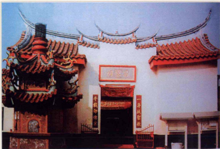
台湾屏東内埔人们为纪念韩愈而修建的“昌黎祠”