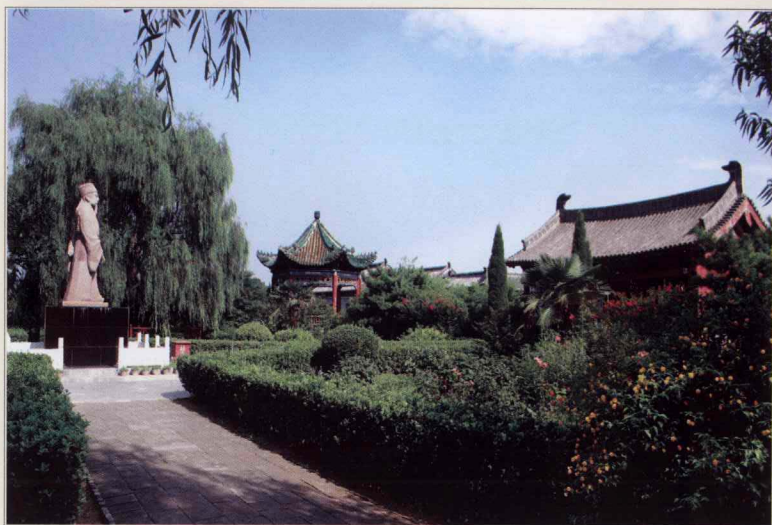
河南省孟州市韩园胜景