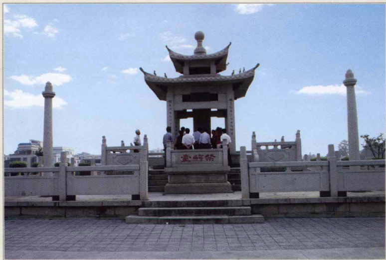
广东潮州境内人们为纪念韩愈而修建的“祭鳄台”