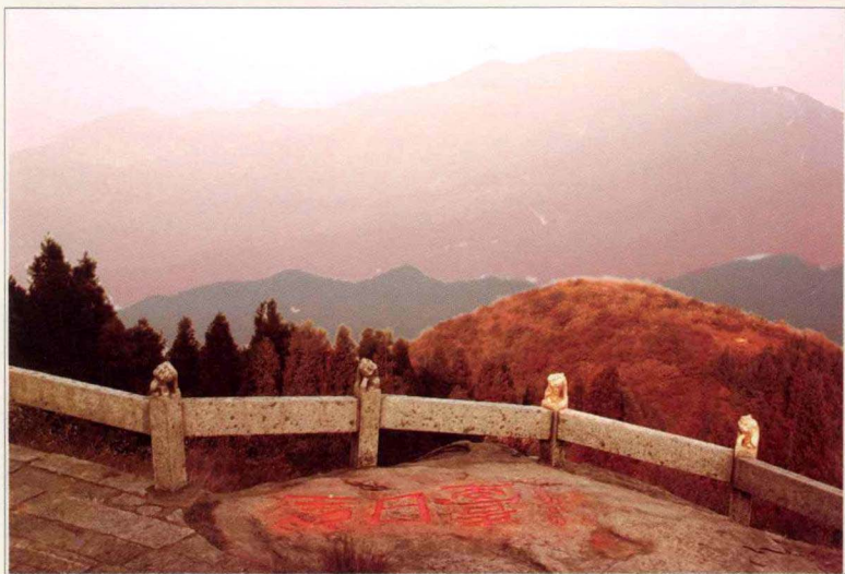
湖南衡山境内人们为纪念韩愈而修建的“望日台”