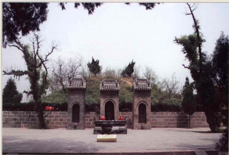
庄严肃穆的韩愈陵墓