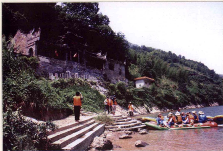
广东省韶关境内人们为纪念韩愈而修建的“韩文公祠”