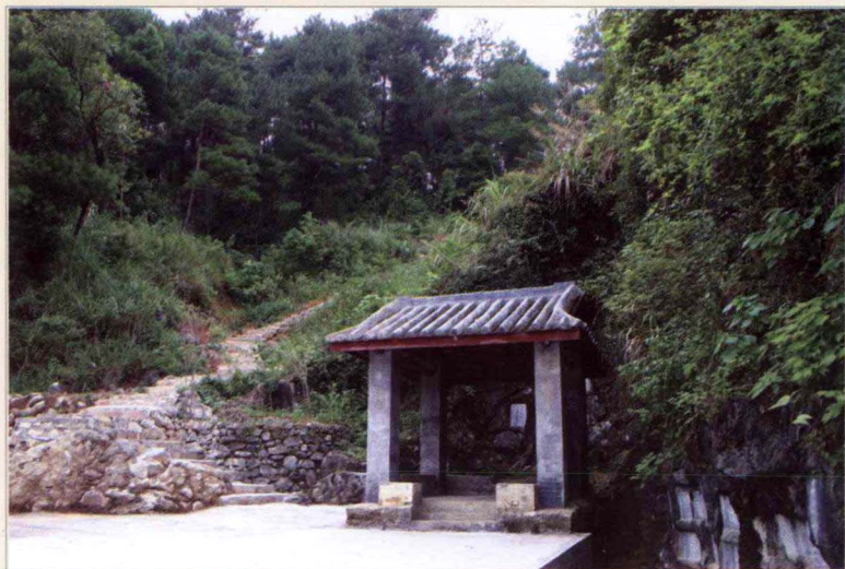
广东省阳山县境内的韩文公“读书台”