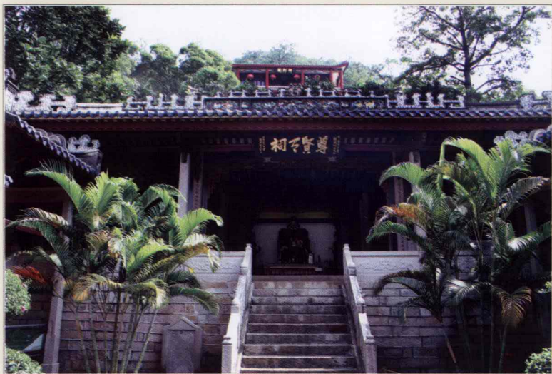
广东省潮州境内人们为纪念韩愈而修建的“韩文公祠”