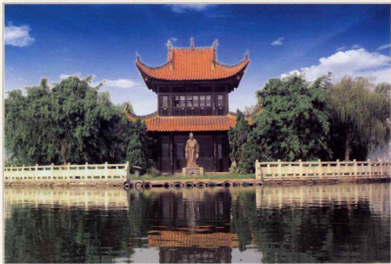
湖南郴州境内人们为纪念韩愈而修建的“叉鱼亭”