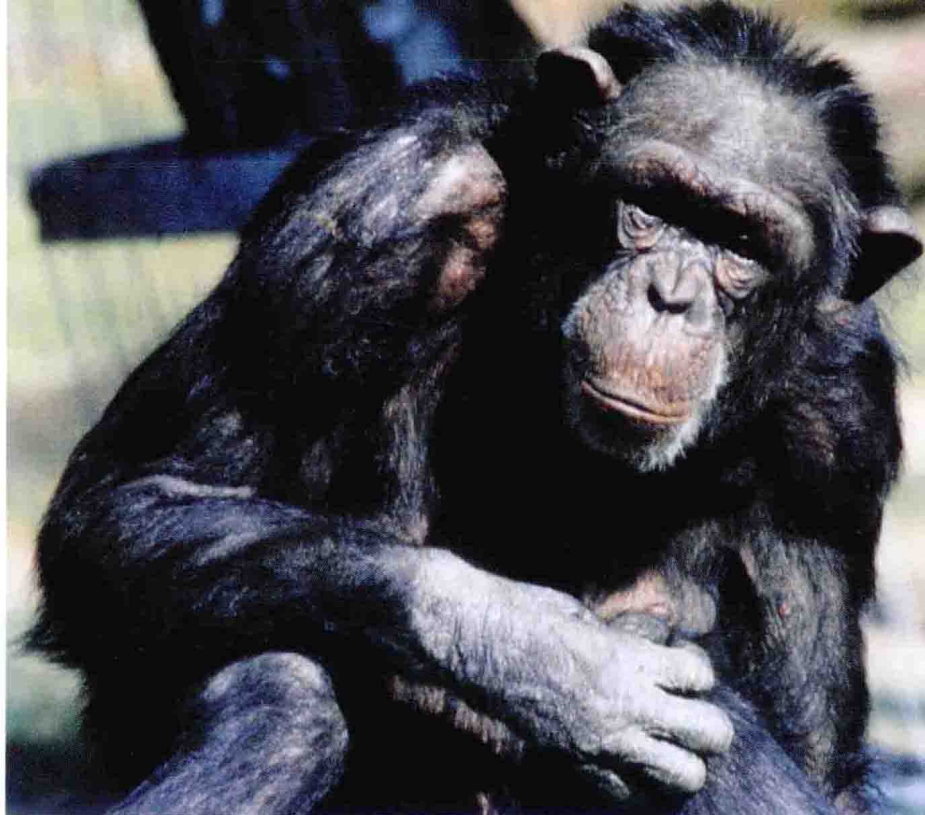
大妈妈，群体中的女家长。