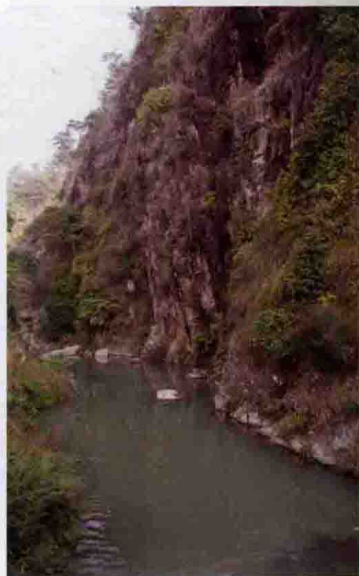
▲ 蔡仙圳，又名仙人圳，位于大埔县百侯镇松柏坑村水口。该圳开凿于南宋开禧元年(公元1205年)，距今已有790年的历史。

这次全县非物质文化遗产普查中，对民间传说的专项普查，是在二十世纪八十年代民间三套集成资料搜集整理的基础上，重点进行查漏补缺的，通过实地采访，搜集了民间传说26篇。如《文武阁传说》、《保生大帝的传说》、《蔡仙人的说》、《龙井潭》、《多宝岩》、《莲花石的由来》、《狮头山的传说》等。