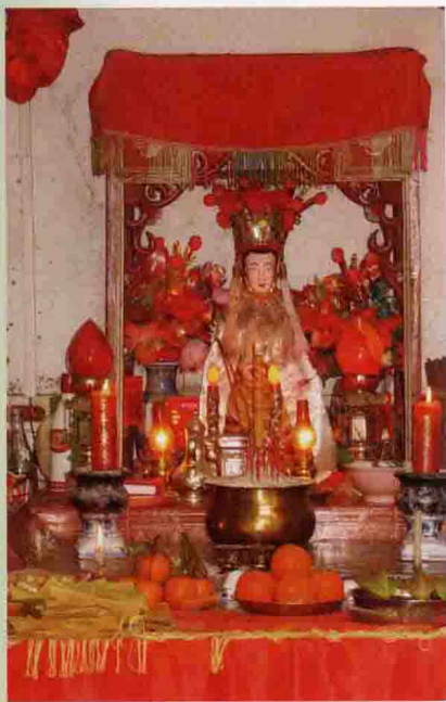
▲ 光德镇洪觉寺供奉的“红衣娘娘”

神话是人类共同体（民族、部落）在氏族时代以原始思想为基础，将自然现象和人类生活不自觉地形象化、人格化，从而集体创作、代代相承的一种以超自然神灵为主角，表征着特定群体的神圣信仰的语言艺术。