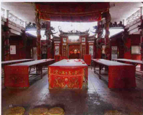
◀ 广福宫，位于大埔县湖寮镇黎家坪村，始建于清朝嘉庆元年(公元1796年)，系保生大帝专祀庙。