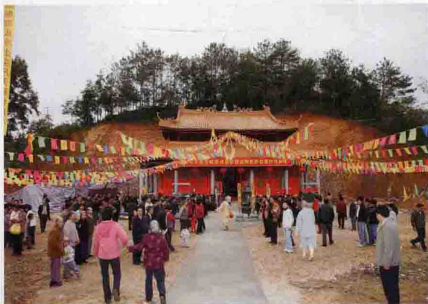
▲ 灵觉寺，又名赤蕨寺，位于西河镇上黄沙村赤蕨，是惭愧祖师潘了拳的专祀庙。

我县民间流传的神话较少，在这次全县非物质文化遗产普查中，仅收集到神话8件，这些作品大多数介于神话和民间故事、传说之间。8件神话分别为《天灯的传说》、《天子岌》、《魁岩寺》、《田鸡婆（浮）塘洪（红）觉寺红衣娘娘》、《惭愧祖师》、《石狮水》、《曾五七神》、《田伯公的由来》等。