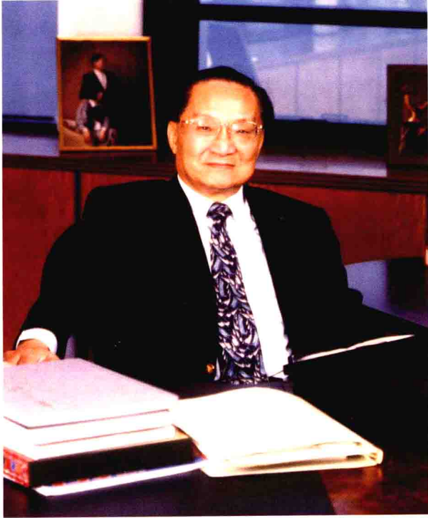
金庸先生（摄于香港）