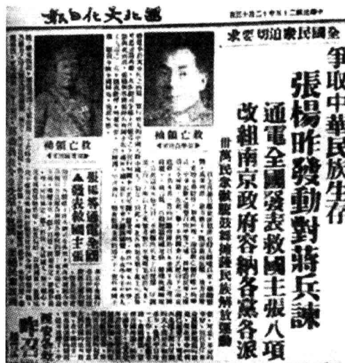
图 16-2 《西北文化日报》关于“西安事变”的报道

国家是谁的？是你们自己的么……真是胡闹，国家的元首也可以被武力劫持！一个带兵的军人，也可以称兵叛乱！这还成何国家……你们这样做是害了中国……那么就不必再想复兴，中国也要退回到民国二十年