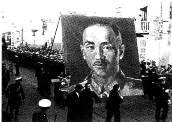
图 16-3 上海市民游行，庆祝“西安事变”和平解决

蒋介石在被扣期间，置生死于度外，不失威仪风度，居然动辄当众斥责张学良。张学良却表现得像个做错事的小孩，任凭蒋介石斥骂，常面露愧色，无语而退。