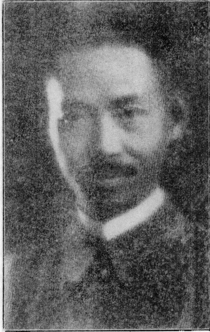
像遺生先佛杏楊事幹總故