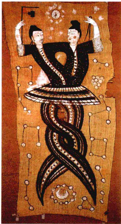
◎ 长沙马王堆出土的伏羲女娲图

当初女娲造出了人类，伏羲教会他们耕作、捕猎。当人们正在大地上幸福生活的时候，祸事来了。在昆仑山有一位火神，名叫祝融，他住在昆仑山的光明宫里，掌管着太阳火种。祝融的心地很善良，并且跟伏羲、女娲的情谊很深。当伏羲跟女娲带领着人类生活在神州大地时，祝融看到人们因为生吃捕获的野兽，很多人得了疾病，于是他便在光明宫引燃树枝，将火种传给了人类。从此以后，人们捕获了野兽，便把兽肉放在火上烤熟食用，这样一来，生