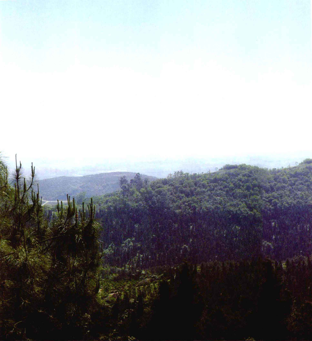
◎ 神奇的天社（老君）山