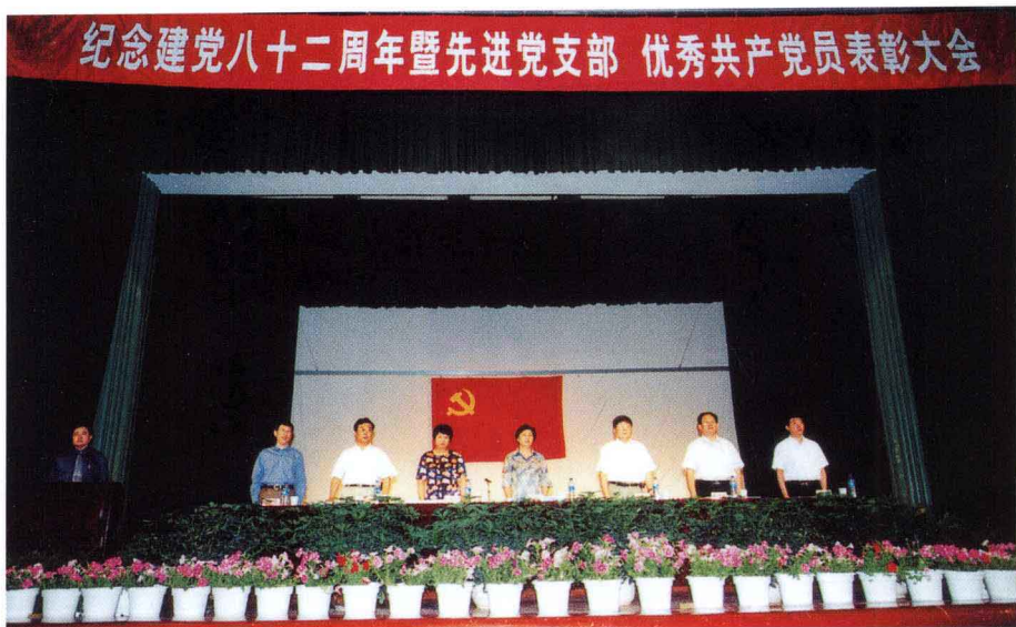
7月1日，我校召开纪念中国共产党成立82周年暨先进党支部、优秀共产党员表彰大会。