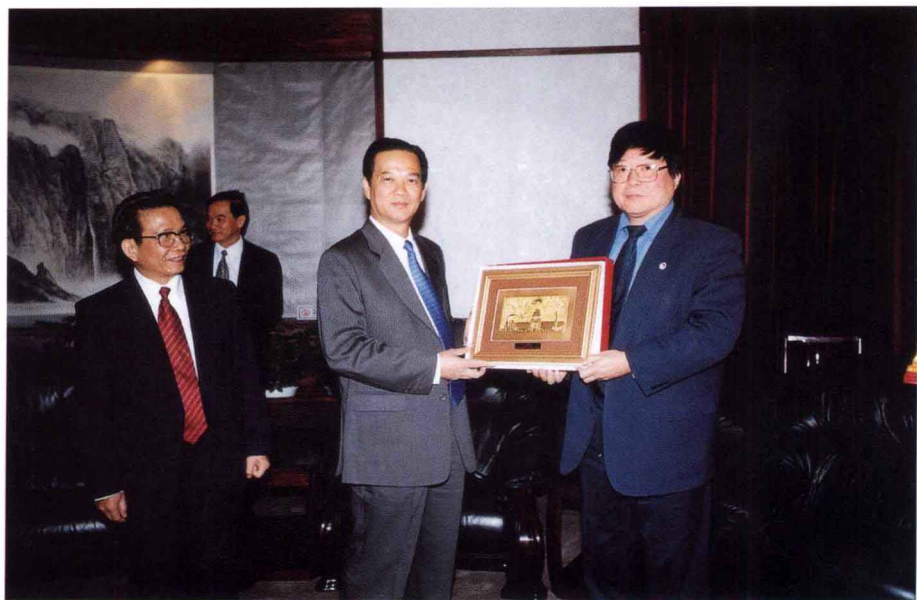
10月16日，越南副总理阮晋勇来我校访问。