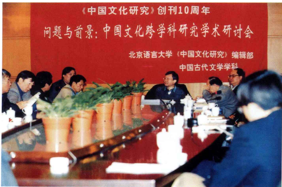
11月22日，我校举办《中国文化研究》创刊10周年学术研讨会。