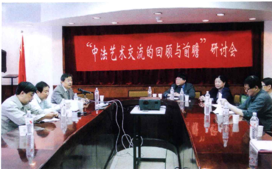
9月24日，我校举办“中法艺术交流的回顾与前瞻”研讨会。