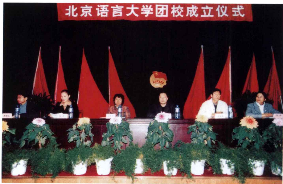
10月31日，举行团校成立仪式。