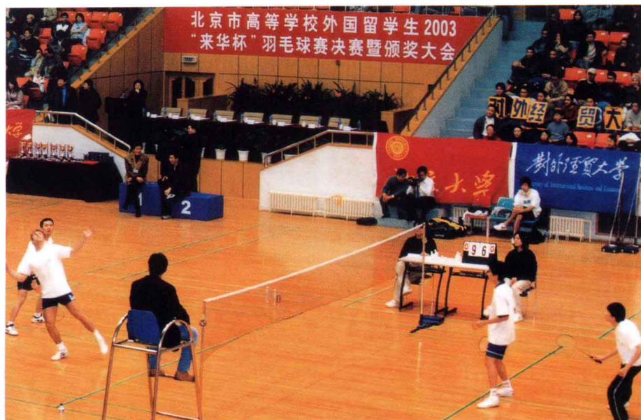
12月5日，举行北京市高等学校外国留学生2003“来华杯”羽毛球赛决赛。