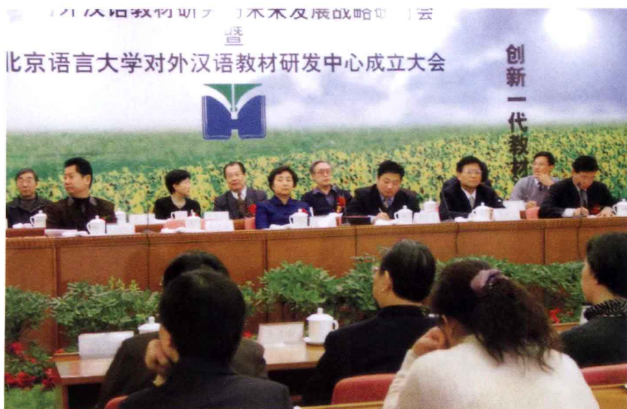
12月20日，我校举办北京语言大学对外汉语教材研发中心成立仪式暨“对外汉语教材研究与未来发展战略研讨会”。