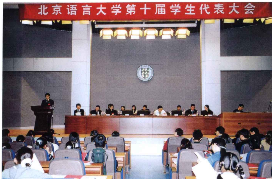
9月25日，召开第十届学生代表大会。