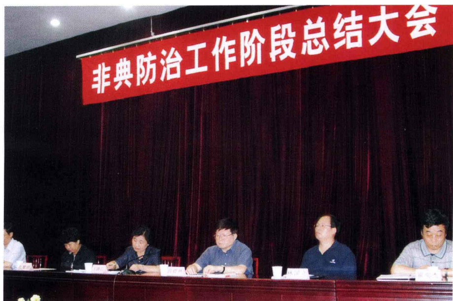
7月10日，我校召开非典防治工作阶段总结大会。