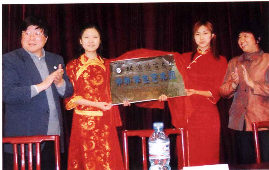
10月15日，举行中外学生艺术团成立仪式。