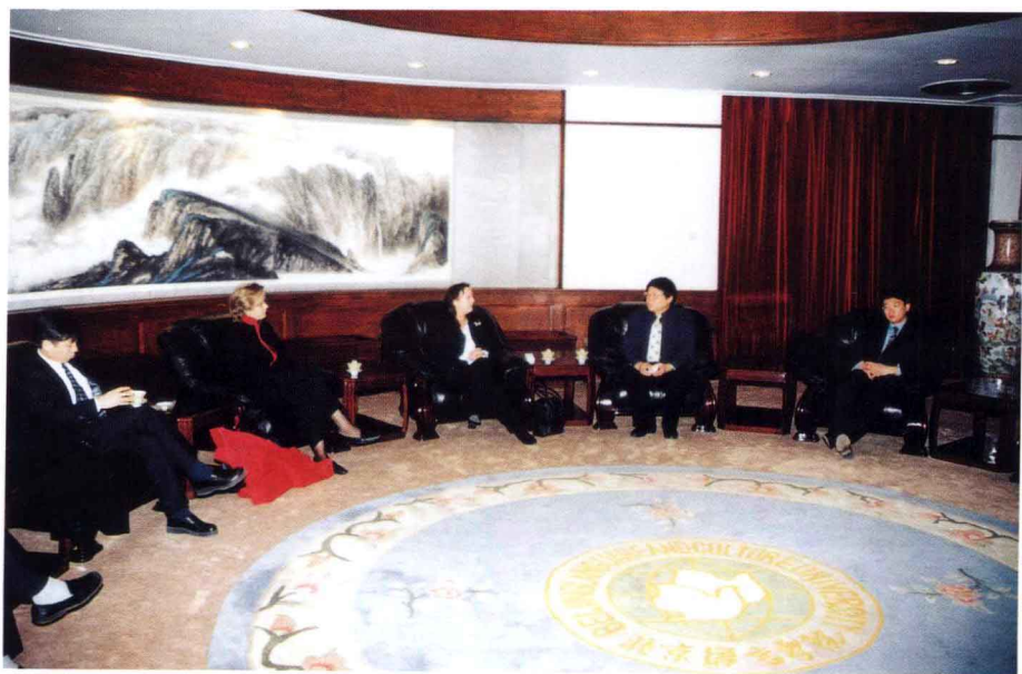
3月17日，美国教育部代表团来我校访问。