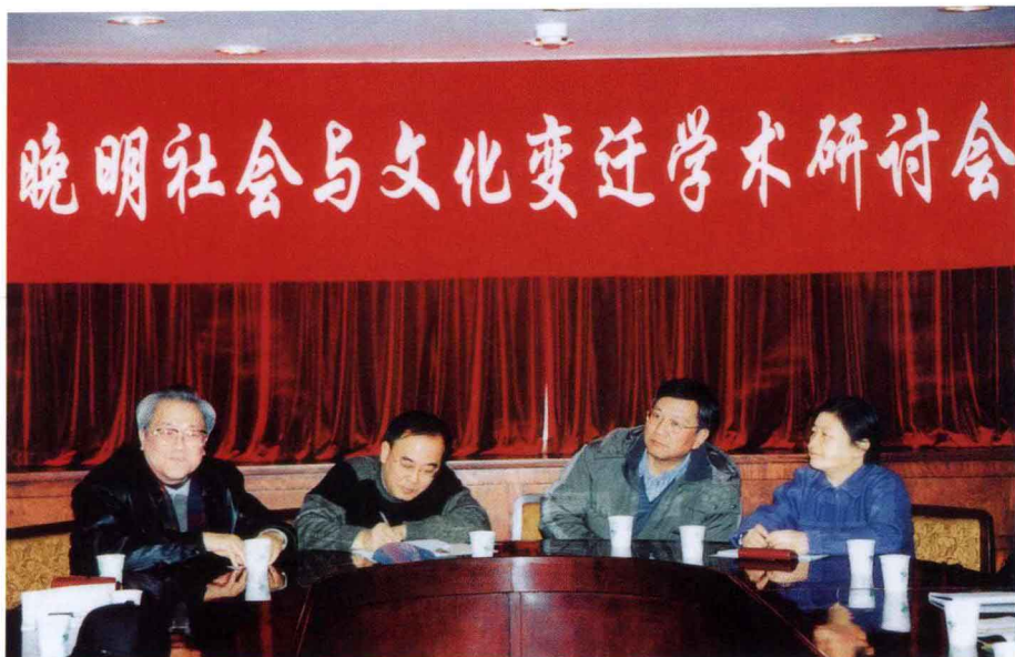
12月15日，我校举办“晚明社会与文化变迁”的研讨会。