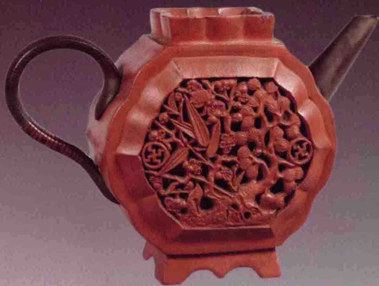
清代 镂空雕紫砂壶