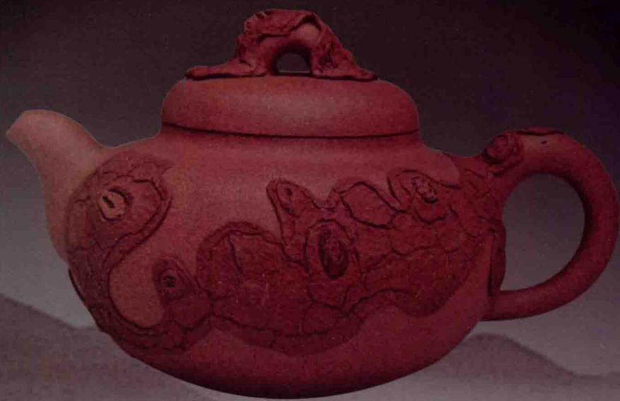
福祿樹瘦壺 (周奇鳴)