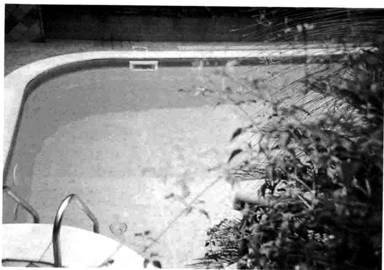
somewhere / 清晨 / 潜水