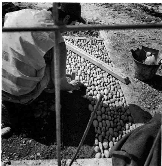
小石子 / 教堂 / 缓缓