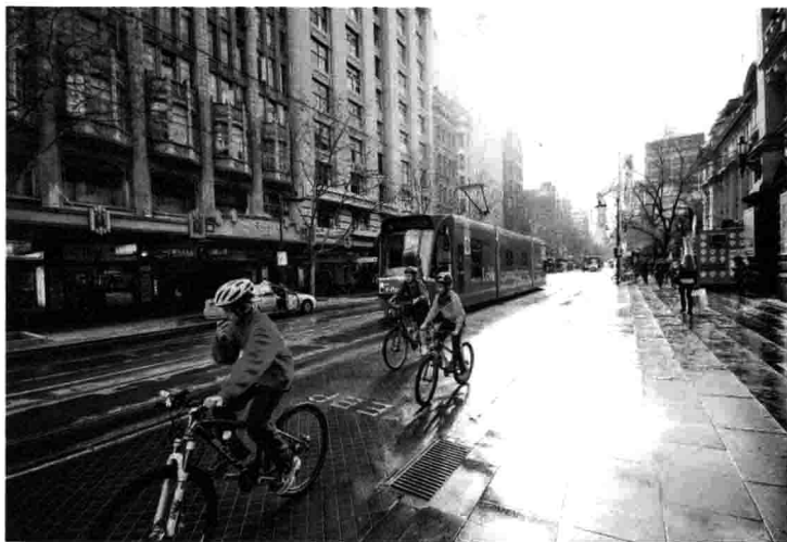
天晴 / 窟东窟东 / 我最喜欢的楼