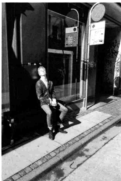
哥本哈根 / 到处 / 都是美少年