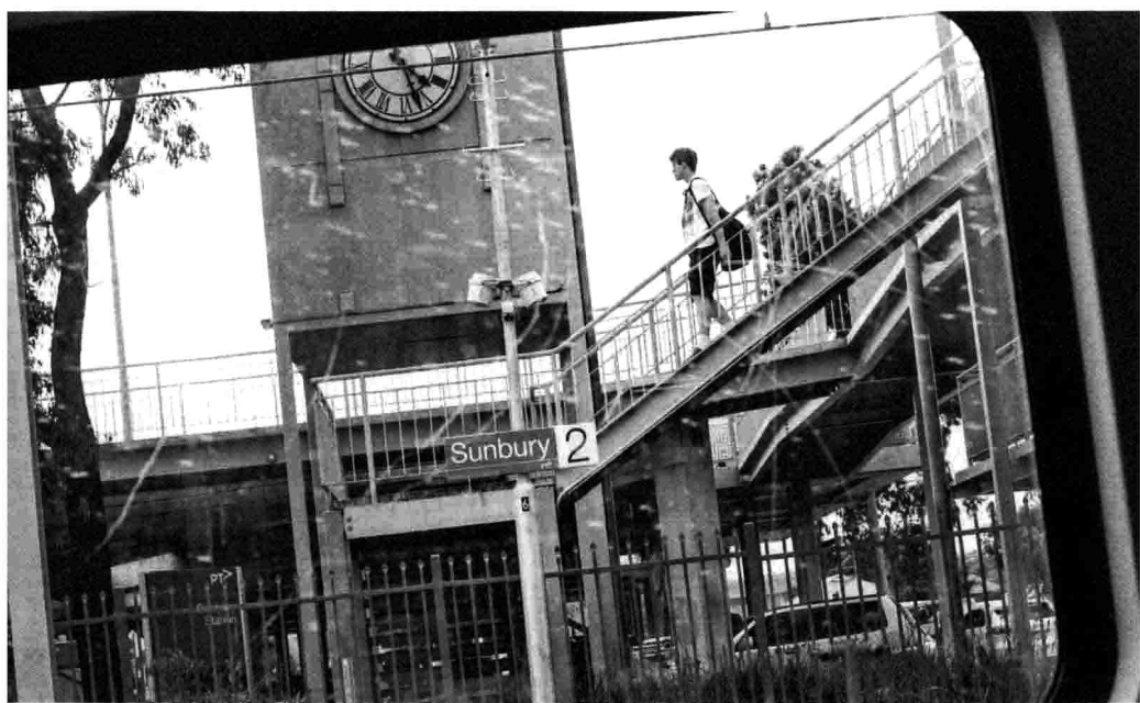
官邸 / 两年 / 帕萨特