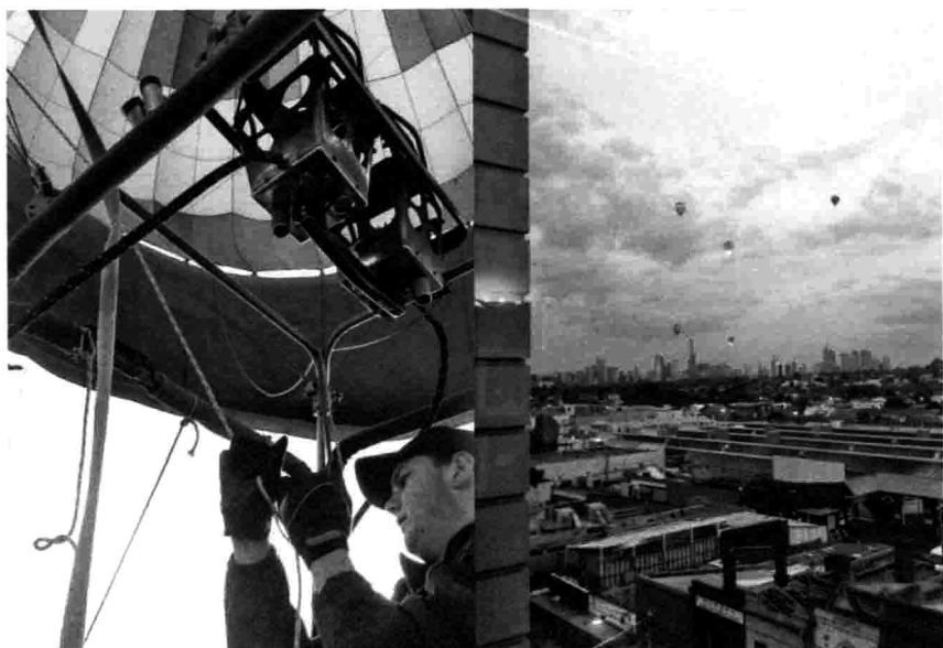
新西兰 / 热气球 / 内森