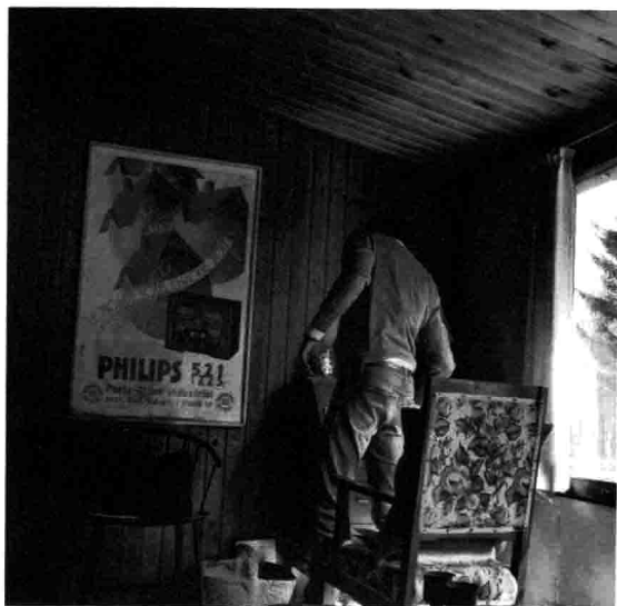
Tom / 小木屋 / 故事