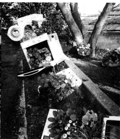
塞特 / 山顶公园 / 晨跑