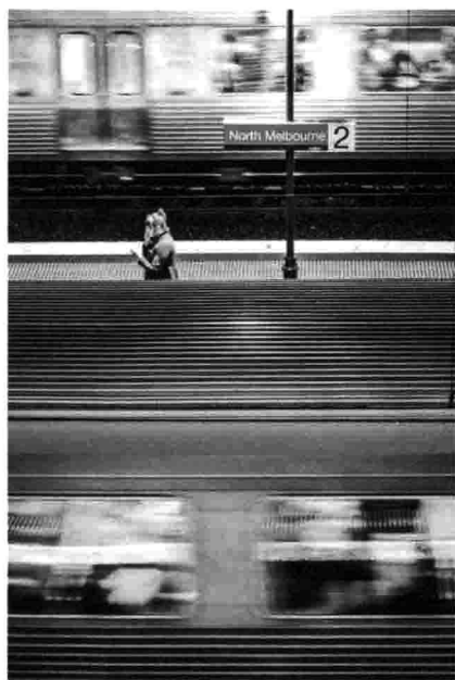
墨尔本 / 火车 / 去哪