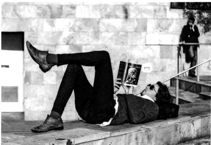
我最喜欢的广场 / 男生 / 都该这样