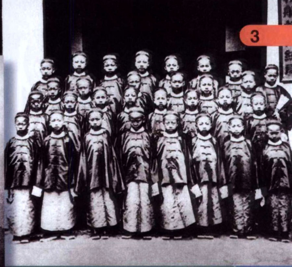
中國第一批出洋留學的學生

領導的軍隊，以及外國洋槍隊的協助下，才把這場歷時十四年(公元1851年至1864年)、席捲十八省的民變平定。