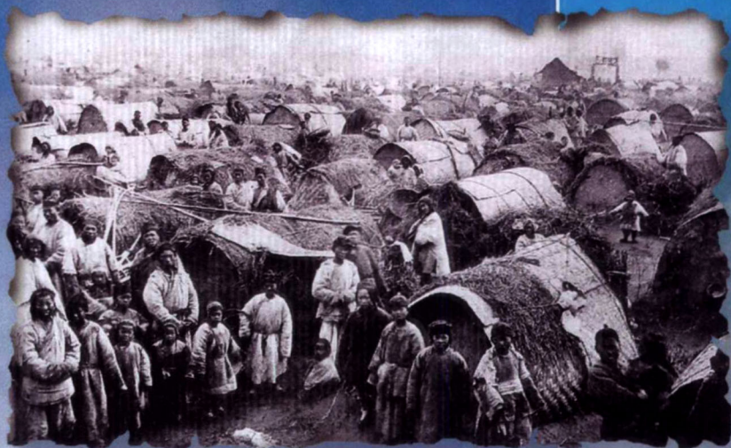
清中葉社會民生苦困