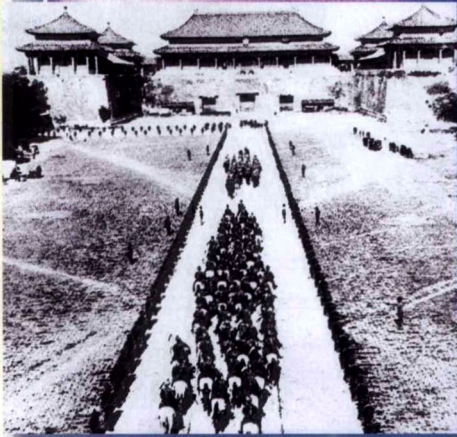
八國聯軍開進北京紫禁城