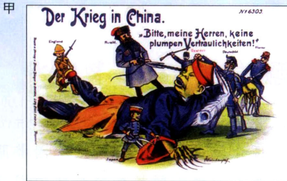
公元1900年 德國 漫畫

乙 中國 是半殖民地，但是 中國 究竟是哪一國的殖民地呢？是對於已經締結了條約的各國殖民地，我們不只做一國的奴隸，是做各國的奴隸…… 中國人 從前只知道是半殖民地，便以為很恥辱，殊不知實在的地位，還要低過 高麗 （被 日本 侵佔）、 安南 （被 法國 侵佔），故我們不能說是半殖民地，應該要叫做次殖民地。