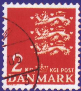
丹麦皇室徽章邮票