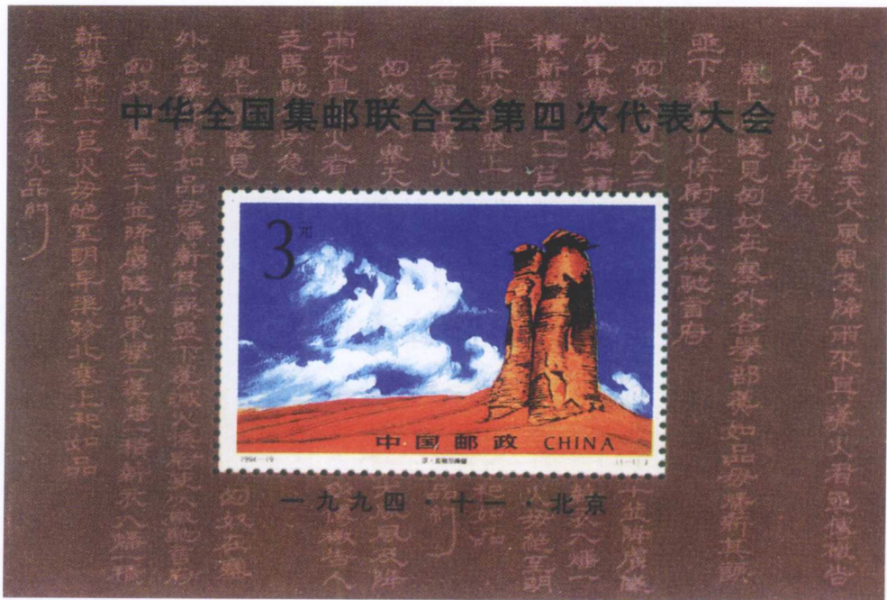
古代烽火台邮票（汉·克孜尔烽燧）

在中国古代，为了传递军事情报，人们在边防军事要塞或交通要冲的高处，每隔一定距离建筑一高台，俗称“烽火台”。在高台上有驻军守候，发现敌情时，白天燃烟，夜间举火，台台相传，可以报警。据说狼粪燃烧时会发出很大的浓烟，在白天时比火光更易被人发现，故而驻军也常用狼粪燃烟示警，因此烽火有时又被称为“狼烟”。这在当时是一种行之有效的方法，也给后世留下了“狼烟四起”的成语以及一个“烽火戏诸侯”的故事。