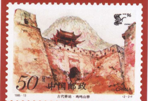
古代驿站“鸡鸣山驿”