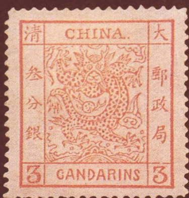
大龙邮票（阔边，叁分银，1882年）