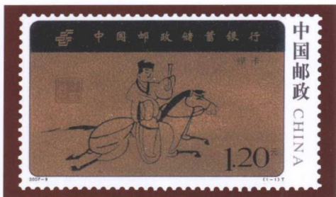
嘉峪关魏晋墓出土的彩绘“驿使图”邮票

站换人换马的接力传递。到了元代，由于军事范围和疆域扩大，邮驿横贯亚洲大陆，规模空前，扬名海外，仅在国内就有驿站1496处，并将邮驿改称为“站赤”。