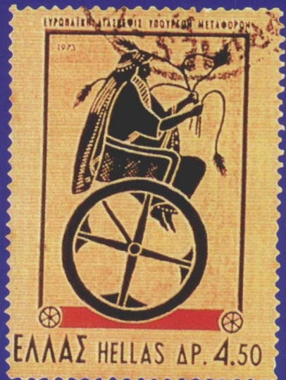
希腊体育题材邮票