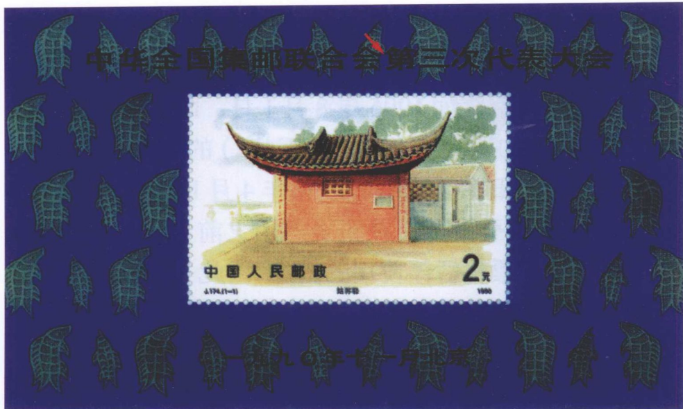
古代驿站邮票（姑苏驿）