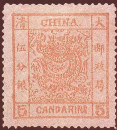
大龙邮票（阔边，伍分银，1882年）