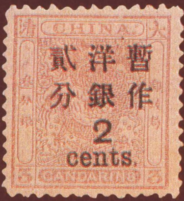
小龙大字改值邮票（贰分，1897年）

邮票（Stamp）是由国家邮政机关发行，供寄递邮件贴用的邮政凭证，自诞生到现在已有150多年的历史。在相当长的一段时期内，这方小小的邮票，方便了人们的通信、交往，为人类作出了巨大的贡献。近些年来，伴随着科学技术的发展以及电话、短信、网络、电邮等现代通信方式的推广普及，邮票逐渐淡出了人们的日常生活；但邮票并没有退出历史舞台，邮票也没有被人们忘记。目前，各个国家的邮政部门还在定期发行邮票，发行邮票的收入还是某些国家重要的财源，这不仅因为邮票发行是一个国家主权的象征，还因为世界各地仍然盛行着以收集、鉴赏和研究为主要内容的集邮活动。