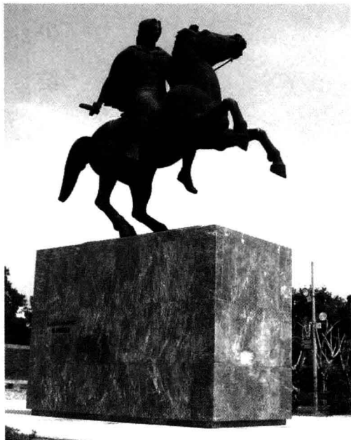
亚历山大大帝雕像

前 324 年，亚历山大大帝带领军队回国。回国后，亚历山大大帝大力整编军队，欲图再开展征服世界的战争。但是，前 323 年 6 月初，亚历山大大帝在巴比