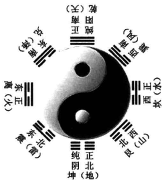
伏羲八卦(先天八卦)