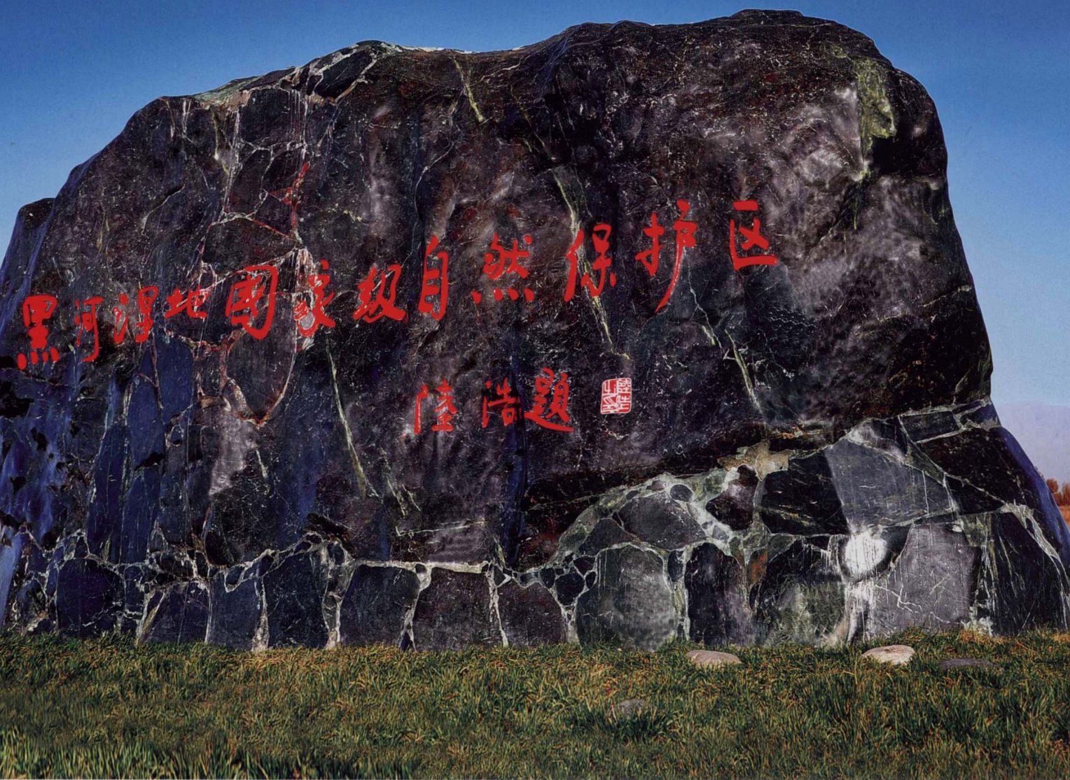
祁连墨玉 360cm × 720cm × 160cm